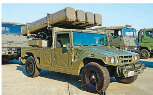
高機動車可改裝為專門作人員運送或貨物搬運，像非裝甲車輛一樣採用多層次玻璃纖維真空成型車身，內部有一層防彈貼裝，可防小型武器和彈片，實際使用時也可外掛裝甲。車身無內置武器但設有槍架，通常會裝備FN Minimi輕機槍。四輪都是雙A臂懸吊系統，每個輪胎可互換，後輪有油壓式4WS；由於大量採用商用車技術，在一般路面也可行駛，採用的Run flat輪胎即使中彈還能行駛。

高機動車是一款日本陸上自衛隊車輛，由豐田汽車研發、日野汽車製造，部分型號可搭載步兵或牽引輕型火炮（圖），也因外型酷似美製悍馬軍車而有「日本悍馬」之稱，於1993年投入生產。