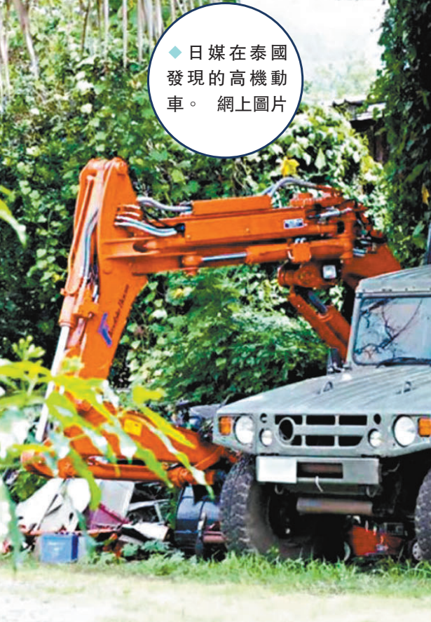
◆日媒在泰國發現的高機動車。