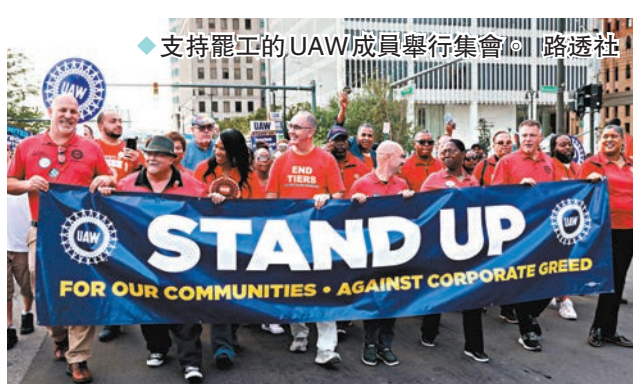
◆支持罷工的UAW成員舉行集會。

香港文匯報訊 美國以底特律為總部的三家最大車廠福特、通用汽車及斯泰蘭蒂斯共約1.3萬名工人，於9月15日凌晨開始在三個州份舉行大罷工，要求未來4年加薪約40%，看齊管理層的薪酬加幅，是美國史上三大車廠首次同時罷工。對此，總統拜登在白宮發言時稱，已派遣副手前往底特律協助調解，並指出車廠的破紀錄利潤應與員工「公平」分享。