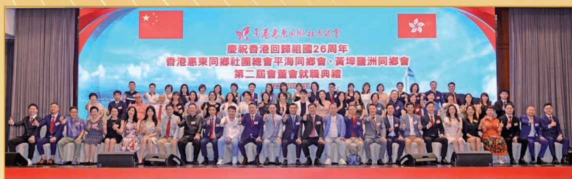
◆平海同鄉會會員大合照。