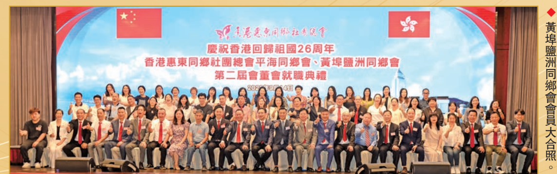
◆黃埠鹽洲同鄉會會員大合照。