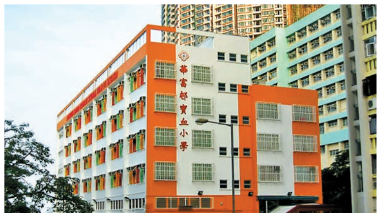
◀寶血女修會日前發出華富邨寶血小學停辦的公告。 ▶華富邨寶血小學網上圖片

香港文匯報訊(記者 陸雅楠)創校逾半世紀的華富邨寶血小學近日公布，將於2025/26學年起停止招收小一學生，並於2028/29學年結束後正式停辦。學校解釋自2019年起受適齡學童人口下降的影響，加上華富邨的重建及搬遷計劃的衝擊，令收生情況雪上加霜。該校的辦學團體寶血女修會認為，學校已難以再為學生繼續提供優質的全人教育，是適當時候計劃逐年停辦，強調現正就讀的所有學生將不受停辦影響，可完成整個小學階段。教育局表示已知悉學校相關安排，會繼續與學校保持溝通，提供適切的協助和支持。