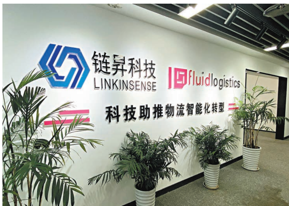
◆鏈昇科技公司力拓智化運營倉庫物流。