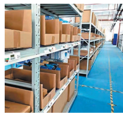
◆安徽鏈昇科技代運營的倉庫內景。