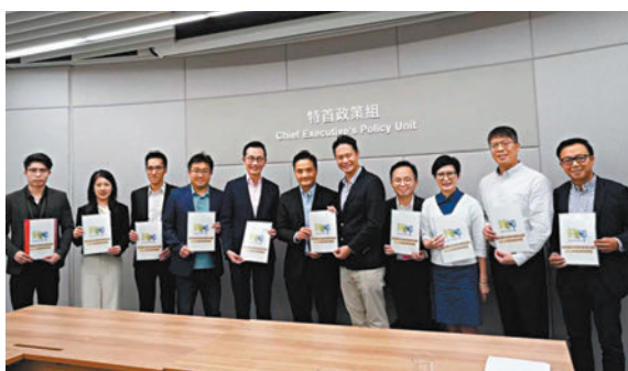
◆ 青評會昨日約見特首政策組，就2023年施政報告表達意見。