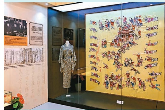
▼圖為展品「毛澤東致宋慶齡的邀請信」。