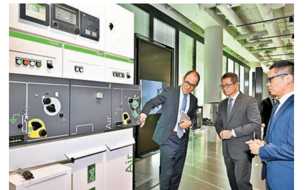
◆陳茂波（右二）在一家聚焦智慧和數碼化能源管理業務企業，聽取公司代表簡介其最新的技術。

兩家企業都正積極擴展在粵港澳大灣區、內地以及亞洲的業務。陳茂波向他們介紹了香港在金融和創科方面的最新發展和優勢，包括引進重點企業和便利人才來港的政策措施，並歡迎他們利