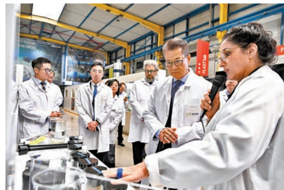
◆陳茂波（右二）到訪其中一家從事水資源管理和轉廢為能技術的企業，並聽取代表介紹業務。

香港文匯報訊 財政司司長陳茂波9月17日（巴黎時間）抵達巴黎，展開法國訪問行程。陳茂波前日到訪兩家法國企業，他們均正積極擴展在粵港澳大灣區、內地以及亞洲的業務，陳茂波向他們介紹了香港在金融和創科方面的最新發展和優勢，並鼓勵他們到港設立研發基地。