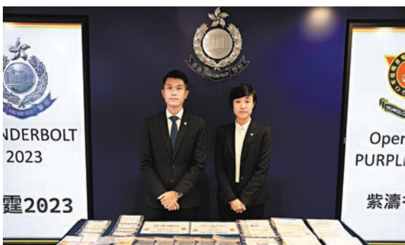
◆警方交代偽造證件集團案情。

香港文匯報訊（記者 蕭景源）自電話卡實名登記制度實施以來，有集團在網上出售實名登記電話卡，以及製造身份證、月結單等虛假文件。香港警方昨日表示，今年7月部署「紫濤行動」，派探員多