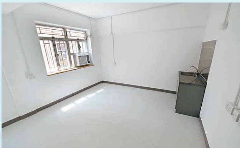
▶禮信大廈過渡性房屋，昨日正式開幕，共提供26個單位，單位面積均為200多平方呎，最快下月入伙。

根據房屋局資料，銅鑼灣過渡性房屋項目每個單位有獨立洗手間，並附設共用煮食空間或茶水間。