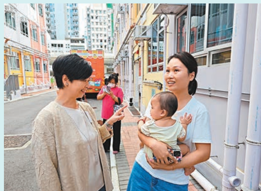
◆何永賢探訪「雅匯」期間與街坊傾談。

香港文匯報訊（記者 文森）香港現有20個過渡性房屋項目正接受申請，特區政府房屋局局長何永賢昨早與新民黨主席葉劉淑儀出席「聚賢薈」過渡屋項目的啟動禮和參觀裝修單位，其後到社聯已入伙的深水埗項目「雅匯」參觀。對於住戶指生活環境大有改善，何永賢表示感到高興，冀助更多基層市民能盡快搬離惡劣居所。