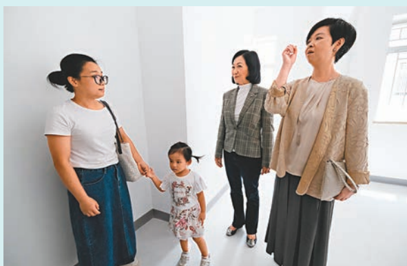
◆住戶參觀時十分滿意。