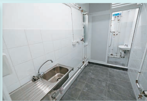
▶單位廚房連通廁所。香港文匯報記者涂穴 攝