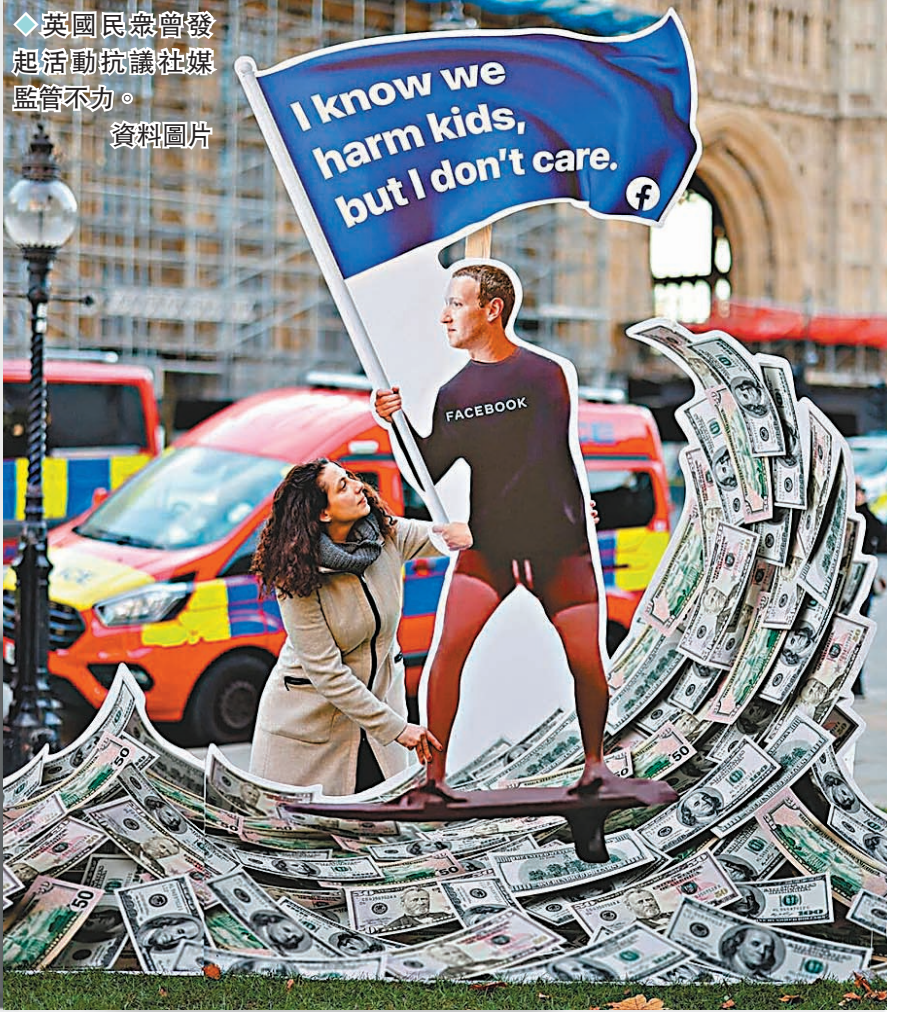
◆英國民眾曾發起活動抗議社媒監管不力。資料圖片