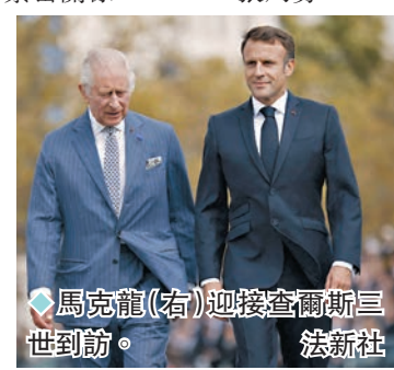
◆馬克龍(右)迎接查爾斯三世到訪。

倫敦大學皇家霍洛威學院法學講師普雷斯科特表示，查爾斯三世加冕後出訪德國和法國釋出重要訊號，「這表明英國不會遠離歐洲，尤其在俄烏衝突期間。」法國記者奧克倫特也表示，查爾斯三世到訪可以稍微轉移輿論焦點，「當然法國肯定會有少許示威，人們會說『為什麼要浪費那麼多錢接待查爾斯三世』。」