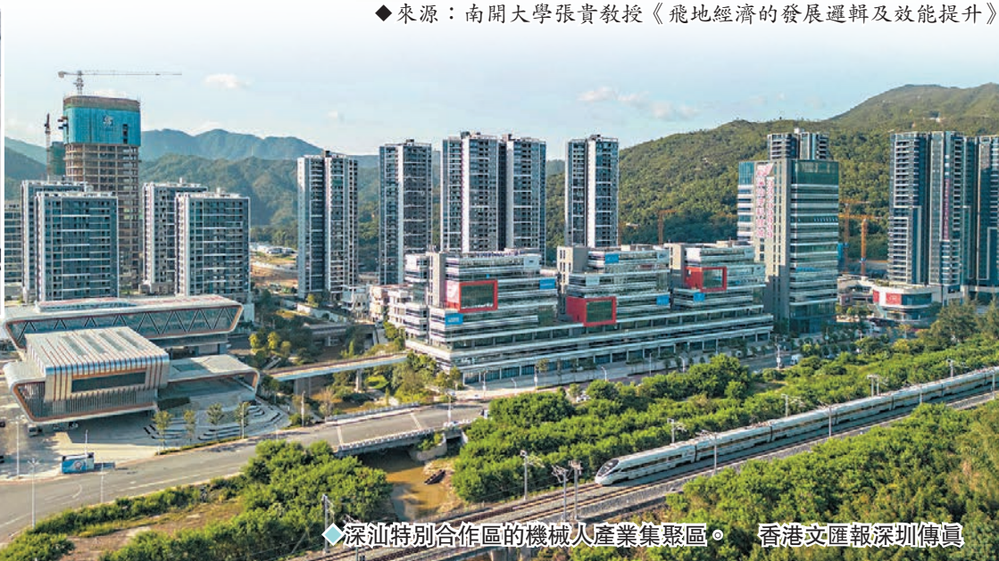
◆ 深汕特別合作區的機械人產業集聚區。

深圳GDP高達3萬多億元（人民幣，下同），常住人口近2,000萬，城市面積卻不到2,000平方公里，土地資源緊絀。而與此形成強烈對比的是，粵東西北地區仍是欠發達地區，亟待發展。