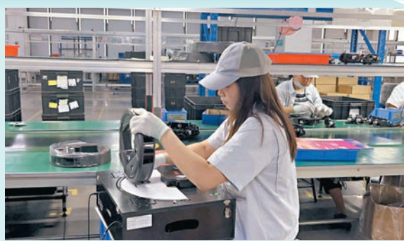
◆ 雲視機器人的掃地機械人生產線。