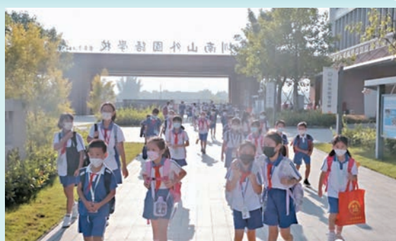
◆ 多家深圳名校在深汕設校。