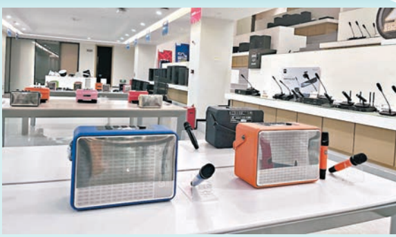
◆ 好兄弟聲學企業展廳。