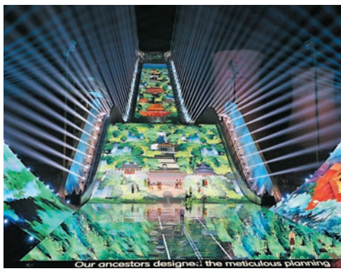
◆圖為節目《故鄉》中展現的北京中軸線。