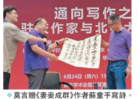
◆莫言贈《妻妾成群》作者蘇童手寫詩。