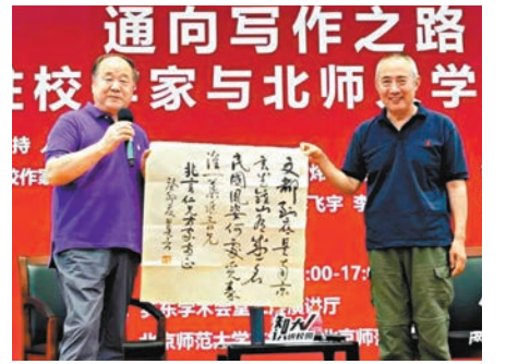
◆莫言贈作家葉兆言手寫詩。