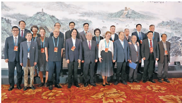
◆參加2023北京文化論壇的文藝工作者大合照。

論壇前夕，在北京石景山首鋼滑雪大跳台舉行2023北京文化論壇文藝晚會。以歌舞《溯源》拉開了晚會帷幕。晚會以詩畫舞的創新表達，展現人類文明的和諧共鳴。節目《同舟》中，來自中國、希臘、埃及、伊拉克、印度的演奏家們同乘一葉小舟，用不同文明的古老樂器奏出《高山流水》《茉莉花》等經典旋律，奏響了人類文明和諧之音。情景串聯節目《問道》《雅集》《守護》《故鄉》《如約》等五段穿越時空的情景演繹，展現了人類文明的神速瞬間。歌曲《最美中國風》融入唐詩、宋詞等中的膾炙人口的名句，掀起一場「最美中國風」。歌曲《故鄉是北京》向防汛抗洪中的最美身影致敬。伴隨着再次響起的熟悉旋律《一起向未來》，台上台下齊聲唱跳、盡情歡舞，重溫「雙奧之城」記憶，將氣氛推向了高潮，最後晚會在歌舞節目《源遠流長》中落下帷幕。