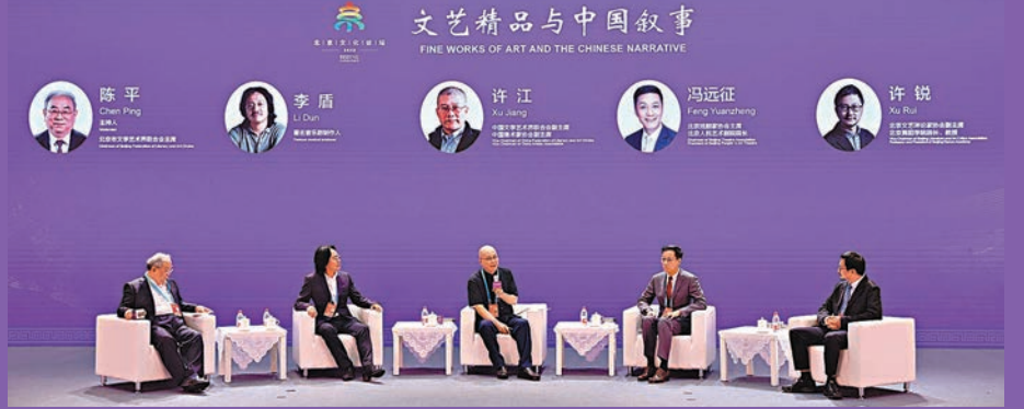
◆2023北京文化論壇「以文化人：文藝價值與社會生活」平行論壇舉行「文藝精品與中國敘事」圓桌對話。

在2023北京文化論壇「中國文學與世界對話」論壇上，著名作家、中國首位諾貝爾文學獎獲得者莫言強調，好的文學作品寫的是普遍人性，文學作品的共同價值觀就是人性，今天寫作的作者還是要重溫沈從文先生教導汪曾祺先生曾經說過的經驗：作家要盯着人寫，要通過講述故事、細節、人物的性格以及內心最深處的部分展開，《戰爭與和