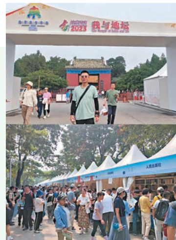
◆2023地壇書市，人山人海。

史老師自嘲職業是生病，業餘在寫作，因為他21歲雙腿殘疾，後來又患腎病，逐漸惡化成尿毒症。雙腿殘疾後的最初幾年，他找不到工作和方向，不知道自己為什麼活着，於是地壇成為他逃避現實的地方。他在《我與地壇》裏記錄了他對死亡生命意義和親情的深邃思考，他說：「無論什麼季節什麼天氣，我都在這個園子裏呆過，地壇的每一米草地上都有過我的車輪印」，他在這裏重新思考死亡，後來想明白了，「一個人出生了，這就不再是一個可以辯論的問題，而只是上帝交給他的——一個事實，上帝在交給我們這件事實的時候，已經順便保證了它的結果，所以此是一件不必急於求成的事。死是一個必然會降臨的節日，而生命的意義就在於你能創造這過程的美好與精彩。生命的價值就在於你能夠鎮靜而又激動地欣賞着過程的美