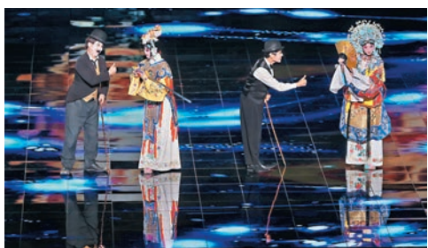
◆圖為節目《如約》，講述了梅蘭芳和卓別林兩位藝術大師的故事。