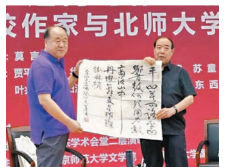
◆莫言贈作家賈平凹手寫詩。

他為創作了《玉米》的畢飛宇寫下「吾家高密東北鄉，遍野曾植紅高粱。自從來了畢飛宇，改種玉米滿地黃。」他還為寫過《妻妾成群》的蘇童寫下「走遍東西南北中，逢人便要說蘇童。自從妻妾成群後，高掛宮燈夜夜紅。」表達自己對作家們與他們代表作的欣賞與喜愛。作家們也都很欣喜收到如此用心的禮物，在台上開心地接過這珍貴的書法作品。