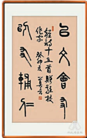
◆莫言題字「以文會友，以友輔仁」。