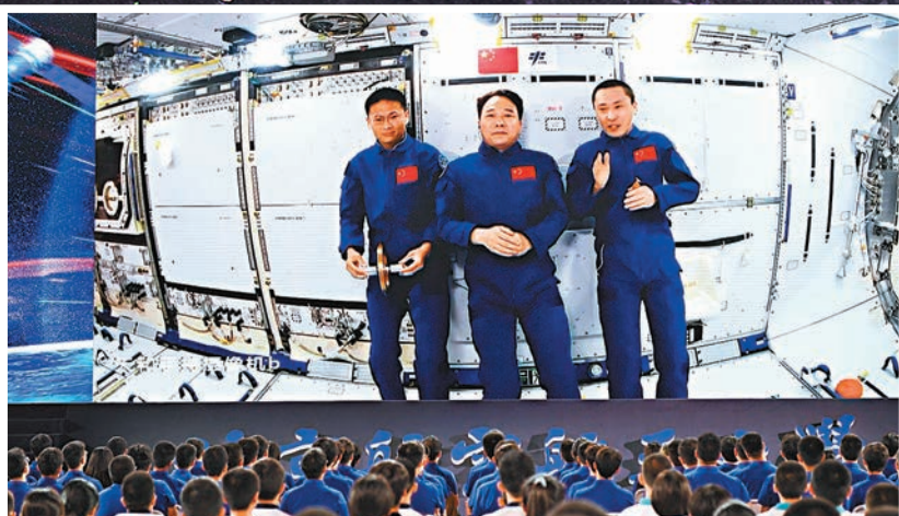
◆「天宮課堂」第四課在中國太空站正式開講，神舟十六號航天员景海鵬、朱楊柱、桂海潮進行授課。

香港文匯報訊（記者 劉凝哲 北京報道）9月21日下午，生動有趣的天宮課堂第四課，在距離地面400公里的中國太空站中開講。蠟燭在太空中首次被點燃，呈現出奇妙的球形淡藍色火焰；用乾毛巾包裹住球拍，就可以在太空站中使用水球進行有趣的「乒乓球」比賽……「博士乘組」神舟十六號航天员景海鵬、朱楊柱、桂海潮用趣味十足的太空實驗，深入淺出地為全國同學們講解了現象背後的科學原理。