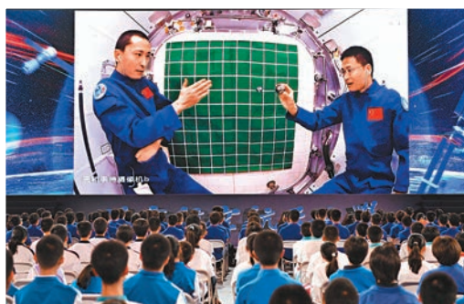
◆航天员正進行動量守恒實驗。