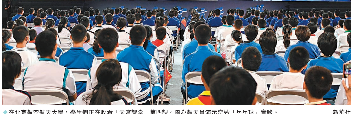
◆在北京航空航天大學，學生們正在收看「天宮課堂」第四課。圖為航天员演示奇妙「乒乓球」實驗。