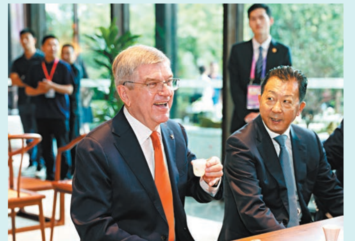
◆國際奧委會主席巴赫（左）在參觀完「中國之家」後品味中國茶。

香港文匯報訊 據新華社報道，杭州第19屆亞洲運動會將於9月23日在杭州奧體中心體育場開幕。22日，亞運會「中國之家」在杭州市湘湖道遙莊園正式開門迎賓。國際奧委會主席巴赫、亞奧理事會代理主席拉賈·蘭迪爾·辛格等出席開門儀式，並參觀了「中國之家」主題展覽。