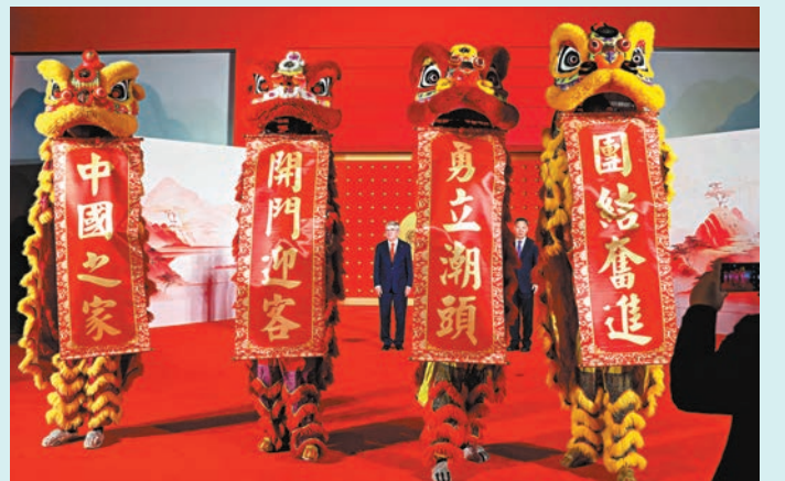
◆「中國之家」開門儀式。

和圖片，回顧、展示在中國舉辦的三屆亞運會；通過與故宮博物院的合作，挖掘和展示中國歷史中深厚的體育文化傳統；通