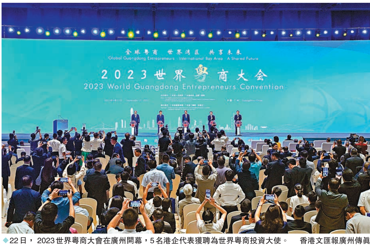
◆22日，2023世界粵商大會在廣州開幕，5名港企代表獲聘為世界粵商投資大使。