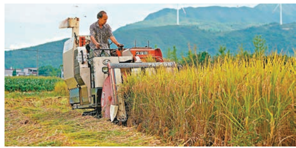
◆廣西壯族自治區桂林市興安縣興安鎮董田村，村民駕駛收割機在田間收割水稻。

支撐。 習近平強調，各級黨委和政府要深入貫徹黨中央決策部署，鑰定建設農業強國目標，穩住農業基本盤，扎實做好新時代新徵程「三農」工作，全面推進鄉村振興，加快農業農村現代化步伐，堅持把增加農民收入作為「三農」工作的中心任務，千方百計拓寬農民增收致富渠道，讓農民腰包越來越鼓、生活越來越好，繪就宜居宜業和美鄉村新畫卷！