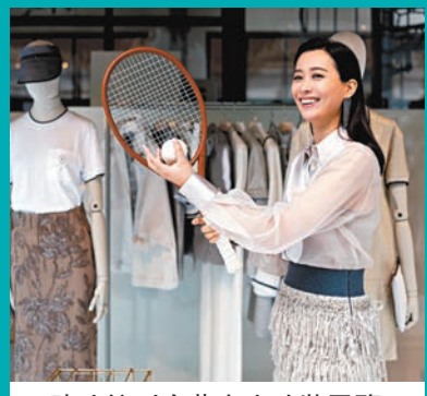
◆陳法拉到米蘭出席時裝展覽。

香港文匯報訊(記者 阿祖)陳法拉近日遠赴米蘭應邀出席品牌春夏女裝系列時裝展覽,率先欣賞新一季的服裝。法拉今次匆匆在當地逗留數天便趕返美國與家人歡度中秋,準備跟女兒小米妮(Mini)一齊做她人生第一個獨一無二的「F&M」自家品牌燈籠。