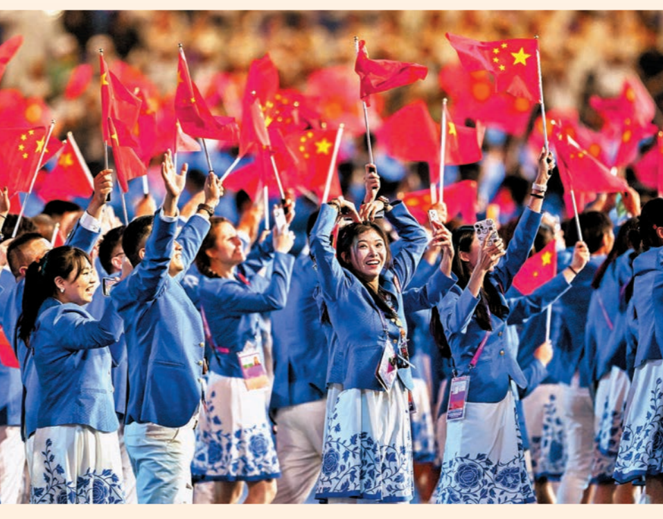
▲中國代表團在開幕式上入場。 新華社