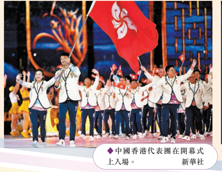
◆中國香港代表團在開幕式上入場。