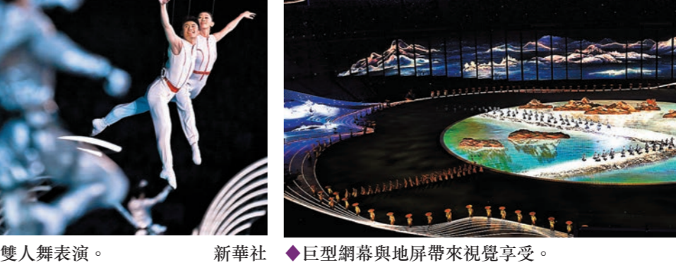
◆開幕式上空中雙人舞表演。

杭州亞運會的開幕式則再一次提高了標準，利用高科技與傳統文化虛實交映，空中雙人舞以及數碼真人火炬手合作點火的場景勢將成為經典，不僅震撼着每一個現場觀眾的心靈，甚至家庭觀眾的親身體驗亦照顧周到，以多角度的呈現出幾可亂真的虛擬煙火，在亞運這個平台，卻交出了「奧運級」的開幕式。 下屆亞運將於2026年在日本名古屋舉行，看到杭州亞運這個別出心裁的開幕式，相信下屆主辦方將十分頭痛。 ◆香港文匯報記者 郭正謙 杭州報道