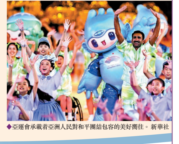
◆亞運會承載着亞洲人民對和平團結包容的美好嚮往。

開幕式開始前，來自浙江各地的群眾帶來富於地方特色的文藝表演，將現場氣氛烘托得十分熱烈。 19時58分，在《和平——命運共同體》的樂曲聲中，習近平和夫人彭麗媛，同亞奧理事會代理主席辛格、國際奧委會主席巴赫等步入主席台，向觀眾揮手致意。全場響起長時間的熱烈掌聲。 9月23日，恰逢中國農曆二十四節氣中的「秋分」。20時整，迎賓表演《水調秋暎》在19座「水玉琮」敲擊出的激昂鼓聲中開始。隨着場地中央的倒計時數字，全場觀眾齊聲呼喊。地屏上，玉琮、玉鳥、神徽等印記與古城遺址一一浮現，從碧綠到黛金，展現春秋耕作的自然軌跡，盡顯良渚文明之光、金色豐收之美。 場地中呈現出大好河山的壯闊景象，一條紅繩鋪展開來，伴着《我愛你中國》的深情旋律，8名儀仗兵邁着堅定的步伐，護衛着中華人民共和國國旗走進場地。全場起立，高唱中華人民共和國國歌。五星紅旗冉冉升起，迎風飄揚。