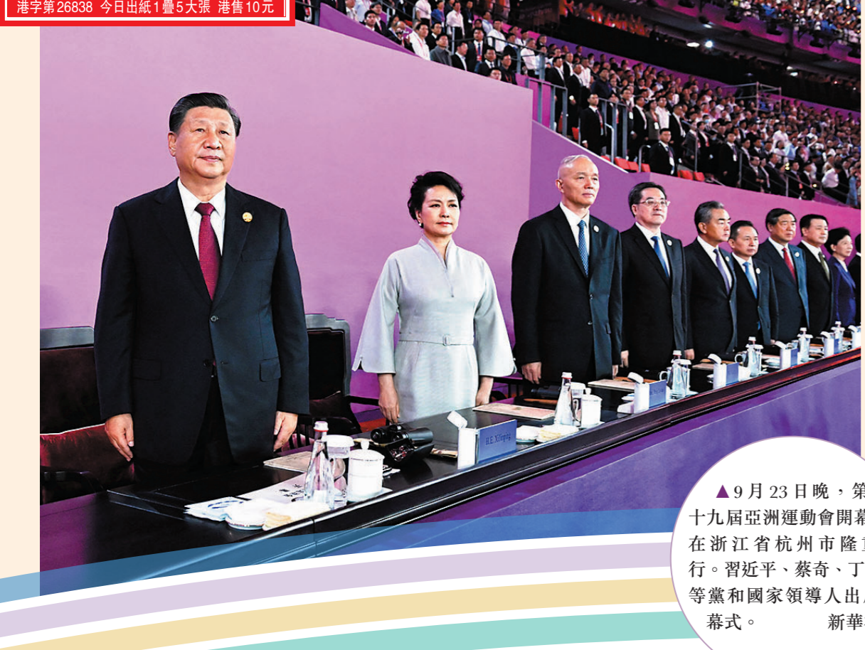
▲9月23日晚，第十九屆亞洲運動會開幕式在浙江省杭州市隆重舉行。習近平、蔡奇、丁薛祥等黨和國家領導人出席開幕式。

潮湧錢江喜迎盛會，攜手同行共創未來。第十九屆亞洲運動會23日晚在浙江省杭州市隆重開幕。國家主席習近平出席開幕式並宣布本屆亞運會開幕。蔡奇、丁薛祥，以及來自亞洲各地的領導人和貴賓等出席開幕式。 夜幕下，坐落在錢塘江畔的杭州奧體中心體育場華燈璀璨，流光溢彩。這座形如一朵大蓮花的建築，見證着亞運聖火第三次在中國點燃。 ◆新華社