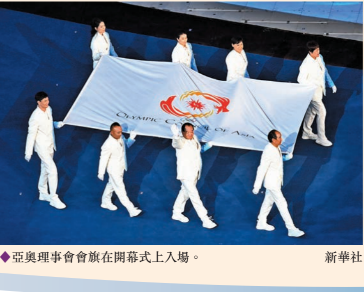
◆亞奧理事會會旗在開幕式上入場。