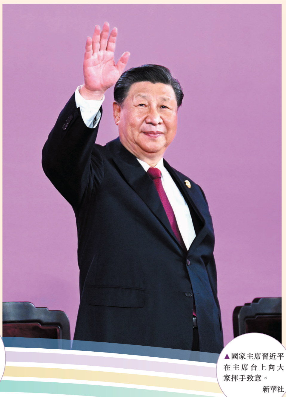
▲國家主席習近平在主席台上向大家揮手致意。