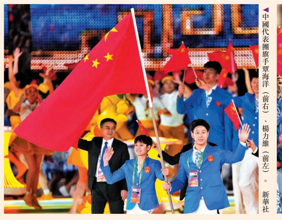
▲中國代表團在開幕式上入場。