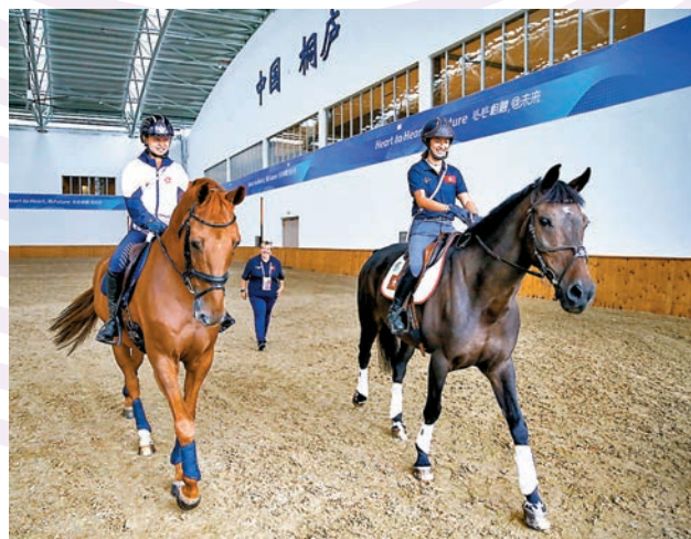
◆馬會馬術隊部分騎手在桐廬馬術中心進行備戰。

此外，香港賽馬會早前與杭州亞運會組委會簽署合作備忘錄，為馬術項目的比賽提供技術支援。