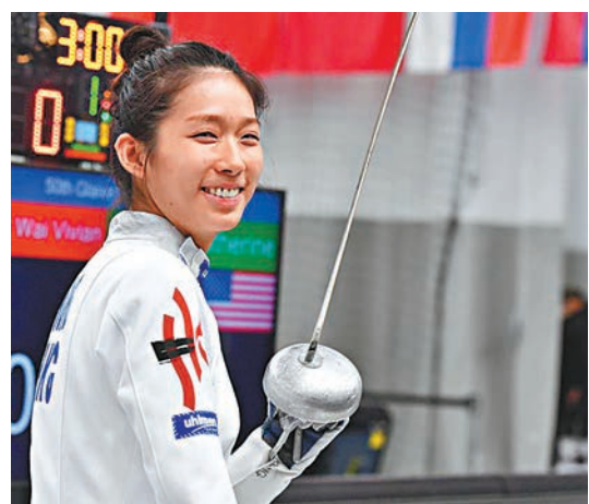
▶江旻德今在女子重劍項目披甲。

曾於東京奧運及早前世大運中奪金的張家朗透露手傷已有好轉，同時有足夠休息，所以身心狀態良好。他指雖然現時心情興奮，但不會給自己太大壓力，並認為早前的世錦賽有助自己適應對手的打法，對亞運有所幫助。張家朗續道，現時亞洲各個國家的水平都提升了