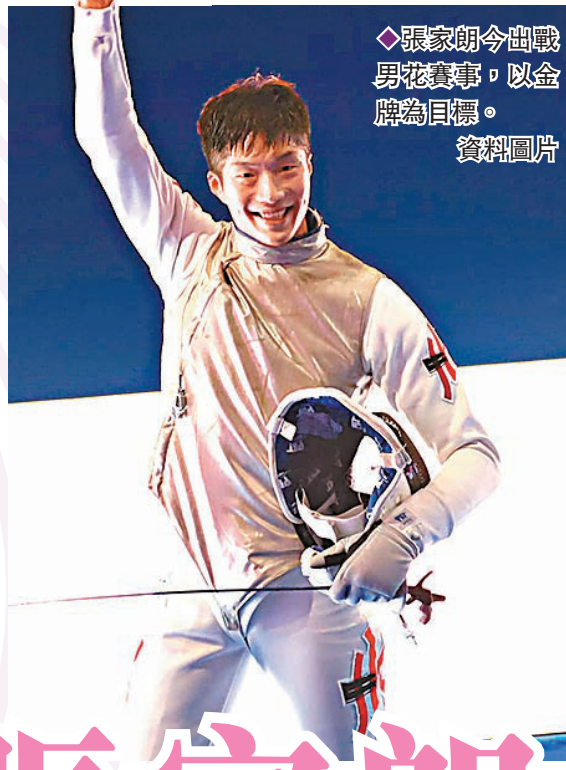
◆張家朗今出戰男花賽事，以金牌為目標。 資料圖片