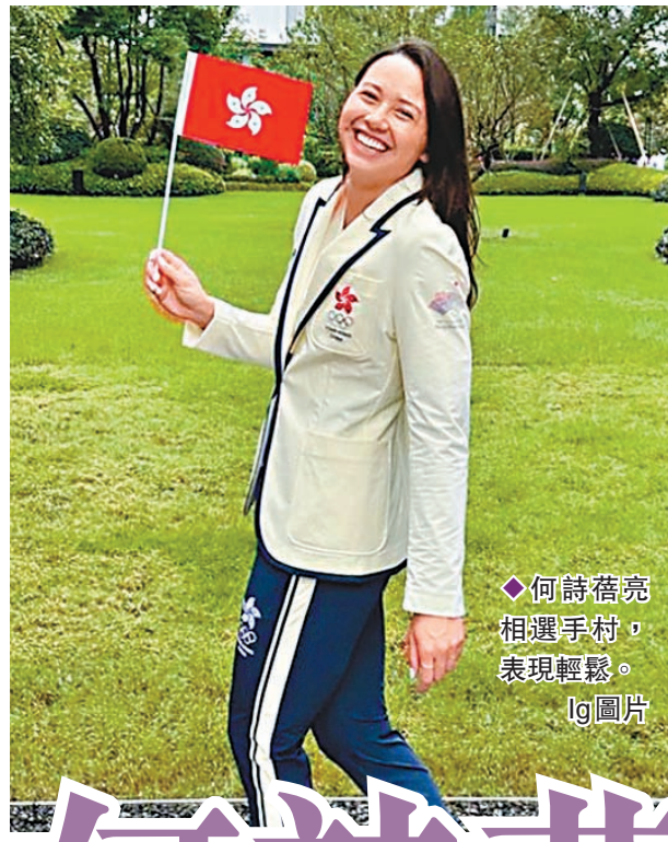
◆何詩蓓亮相選手村，表現輕鬆。