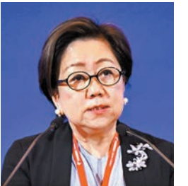
◆史美倫 香港文匯報上海傳真

香港具有連接不同經濟體、不同區域經貿合作的地位，香港可支持國家參與區域經濟合作，促進國家與中東地區、亞太、歐洲、「一帶一路」沿線等地區進行多種形式合作。在人民幣國際化方面，史美倫說，可依託香港作為全球最大離岸人民幣市場優勢，促進在岸市場和離岸市場的良好互動，推動人民幣在境外信貸發展、基礎設施投資、金融產品投資、大宗商品定價等，強化人民幣在不同區域和國家廣泛使用。