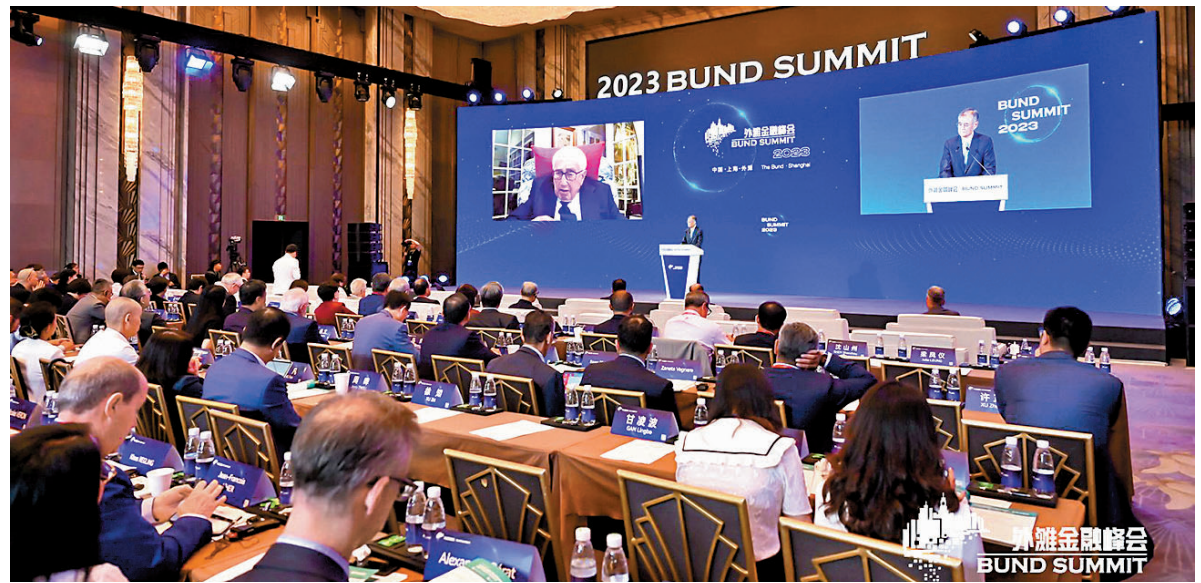
◆「2023 第五屆外灘金融峰會」現場。

第五是「中國對外開放市場闊、潛力大。」寧吉喆強調，近期，中央深改委審議通過《關於建設更高水平開放型經濟新體制促進構建新發展格局的意見》指出，要擴大市場准入，全面優化營商環境，完善服務保障體系。中國政府發布的《關於進一步優化外商投資環境加大吸引外商投資力度的意見》指出，要擴大電信、金融、生物醫藥等領域服務業的開放。「這些都彰顯了中國進一步擴大對外開放的決心和意志，有助於留住外資繼續深耕中國，有助於吸引留住外籍人士在中國工作和生活，同舟共濟、實現共贏。」