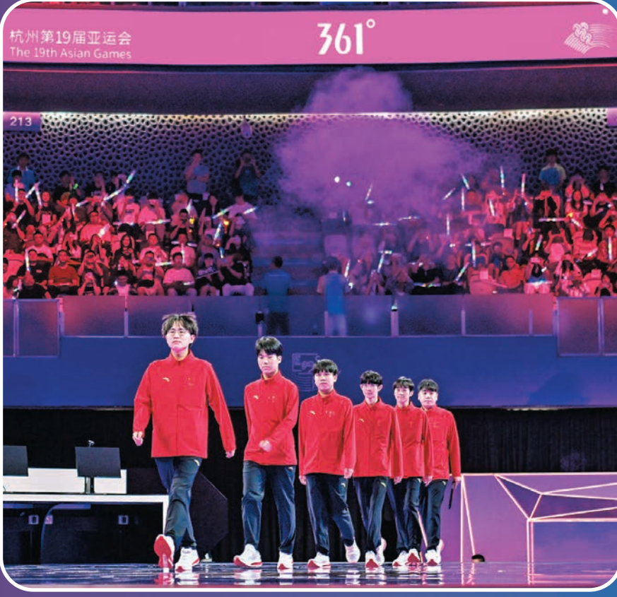
◆中國隊選手進入比賽場地。