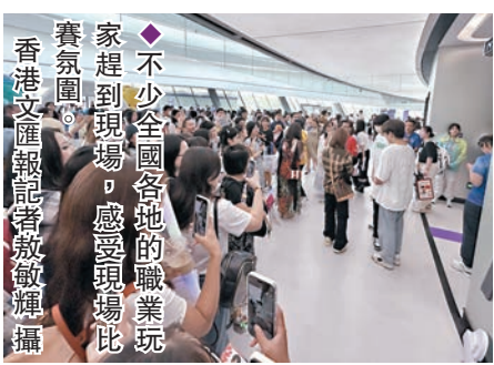
◆不少全國各地的職業玩家趕到現場,感受現場比賽氛圍。

據新華社報道,中國隊在首局比賽伊始就在野區取得優勢,隨後更是通過多次團戰將優勢不斷擴大,比賽第9分鐘,中國隊經濟領先已經達到6,000。第10分鐘,中國隊拿下兩條「中立生物」,隨後一鼓作氣推倒敵方「水晶」,拿下首局。第2局,士氣正盛的中國隊已經讓對手難以招架,比賽再一次以較大差距