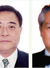
楊顯中 博士 SBS,OBE,JP