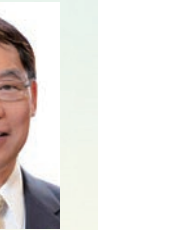
陳新滋 教授 JP