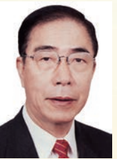
楊孫西 博士 GBM,GBS, SBS,JP