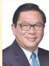
林健鋒 議員 GBM,GBS, SBS,JP