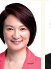
李慧琼 議員 GBS,SBS,JP