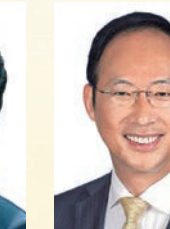
衛炳江 教授 JP