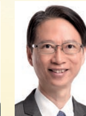
潘國華 議員 JP