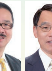
周振基 博士 GBS,SBS, BBS,JP