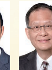
林群聲 教授 SBS,JP