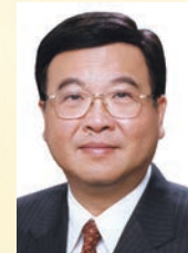
黃玉山 教授 GBS,SBS, BBS,JP