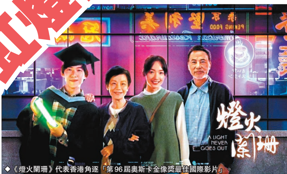
◆《燈火闌珊》代表香港角逐「第96屆奧斯卡金像獎最佳國際影片」。

他又說：「雖然燈光熄滅了，但人的精神依然在，希望旅遊發展局或藝術發展局多舉行有關電影、攝影作品或有中國色彩元素的水墨畫展，從而向全世界宣傳香港，令到更多人睇到香港文化的色彩，同時希望香港電影從業員，拍更多好電影給大家欣賞。」