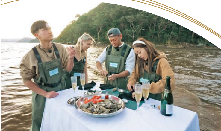
◆振朗開蠔殼技術嫻熟。