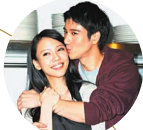
◆王力宏與李靚蕾昔日溫馨一去不復返。

王力宏律師表示：「今天是強制執行程序，這個程序是我方申請的。很遺憾裁定的大部分內容對方沒有履行。因此我們希望透過法律程序，實現裁定的內容，讓我們能見到生命中最重要的人。」