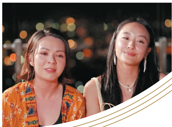
◆JW與陳滢說到傷心處忍不住淚崩。

首站行程，三人去到新南威爾士中央海岸體驗原住民文化，之後齊齊換上釣魚褲站在海中大嘆海鮮餐，振朗開蠔殼的動作相當專業，他自爆：「我以前曾經離酒店做開蠔。」令人意想不到。