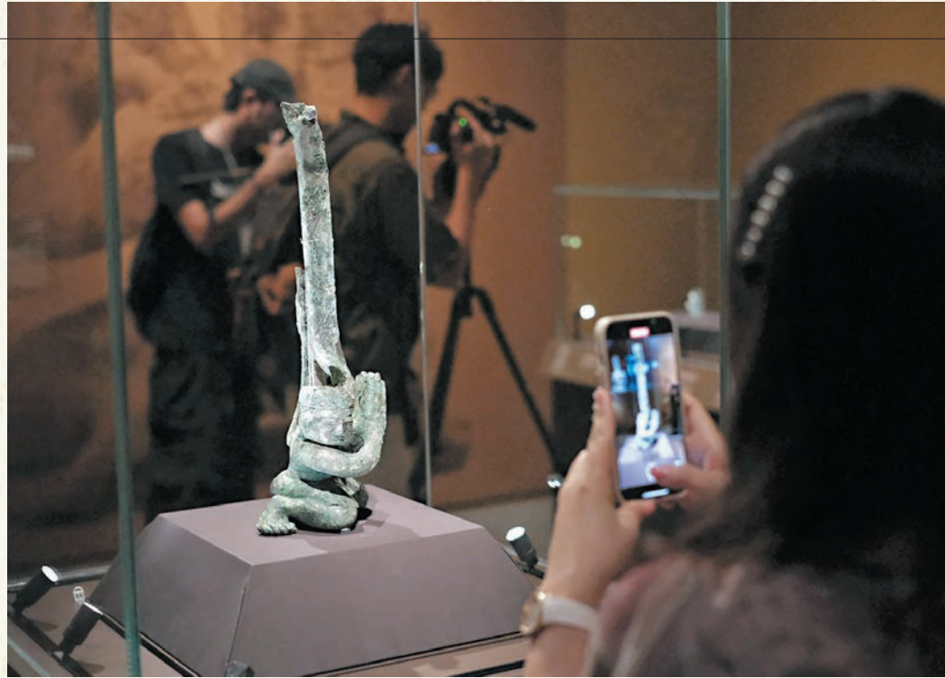
◆觀展者以手機攝下珍貴文物的照片。