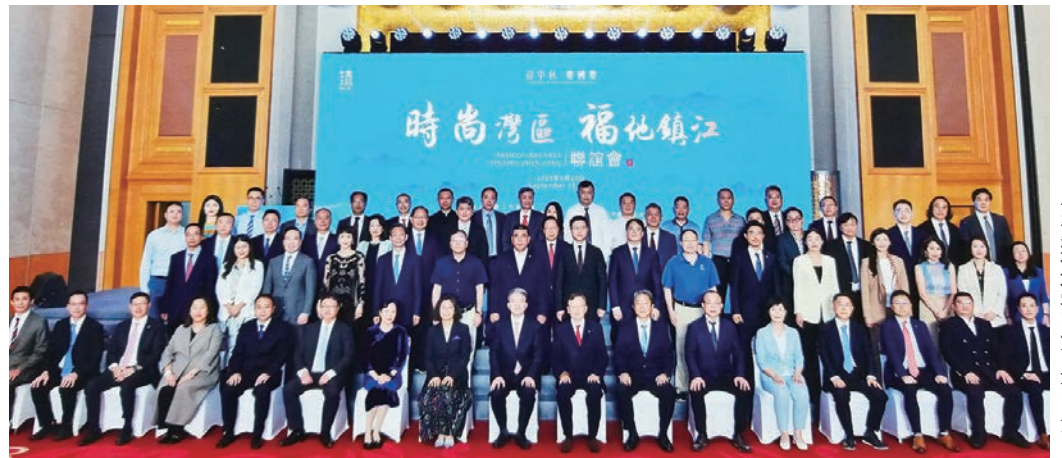
◆活動現場賓主合影留念。

鎮江市政協日前赴深圳市舉辦「時尚灣區、福地鎮江」聯誼會,與省、市政協港澳委員及粵港澳大灣區鎮江鄉賢代表在創新之都、海濱之城深圳歡聚一堂,共敘鄉情、共話未來。