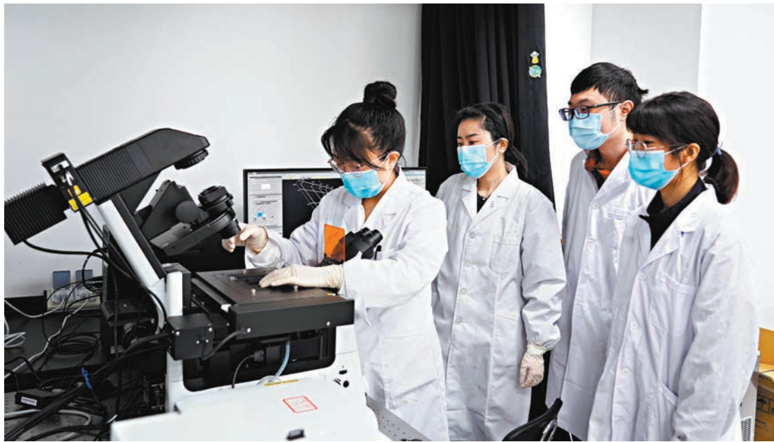
▲深圳提出加快構建聯通灣區、輻射香港的軌道網絡。圖為河套深圳園區內，香港城市大學福田研究院內的科研人員在做實驗。

同時，未來深圳園區將整合兩大口岸和各類交通設施，打造具有國際影響力的口岸門戶，規劃引入穗莞深城際等，攜手香港園區銜接香港新田科技城、深圳光明科學城、西麗科教城、東莞松山湖、廣州科學城、中新知識城等灣區重大科創平台，促進香