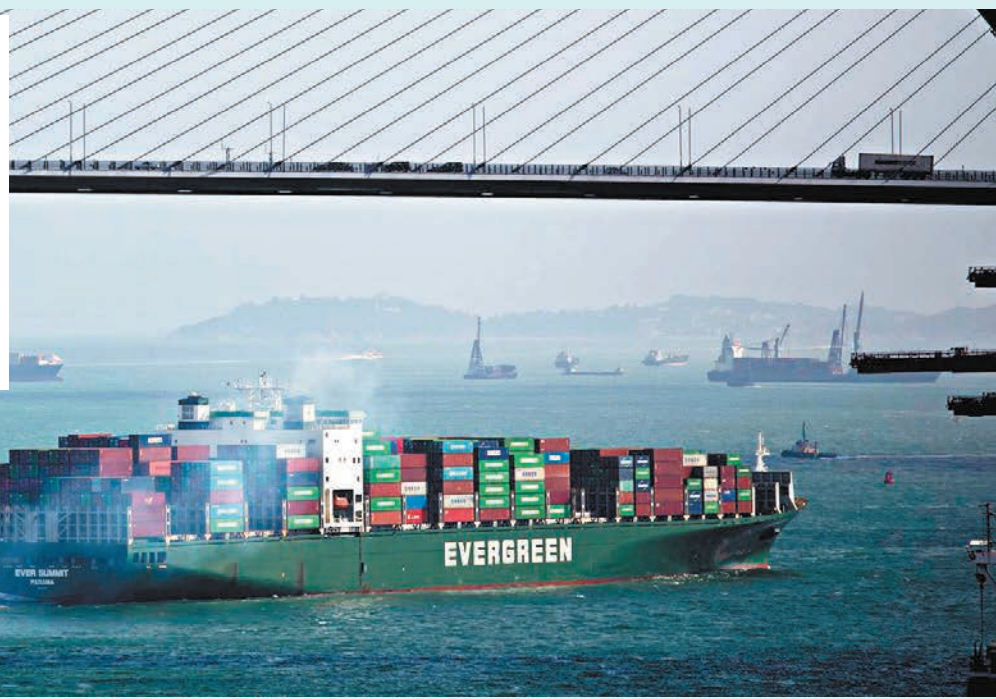
受到美聯儲加息等因素影響下，貿發局再次修訂今年香港出口增長預測，調整至收縮介乎7%至9%。