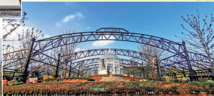
◆美國哥倫布園。