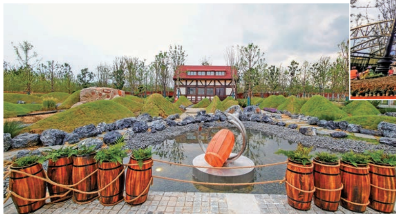
◆德國奧斯納布呂克園。