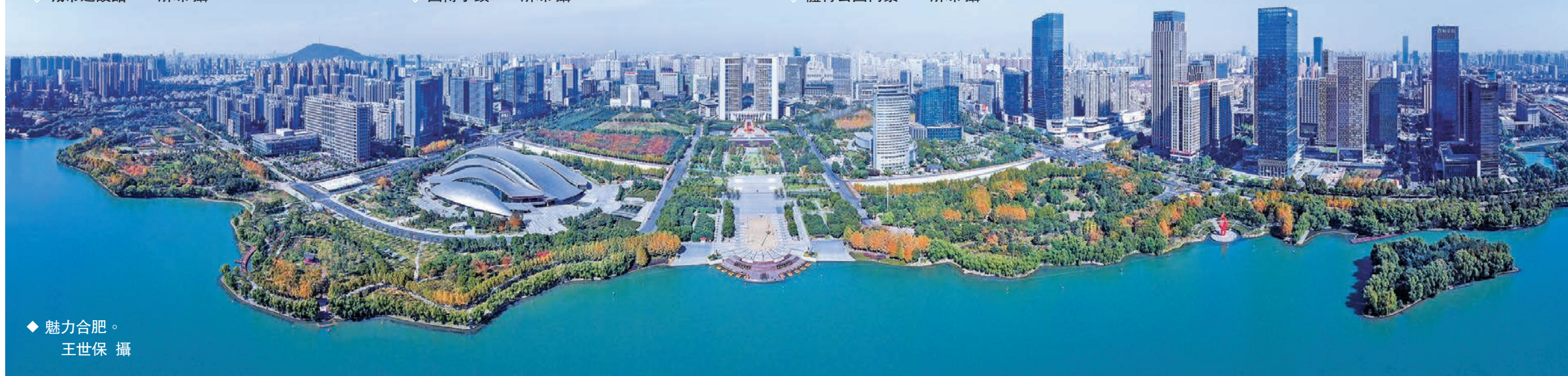
◆魅力合肥。