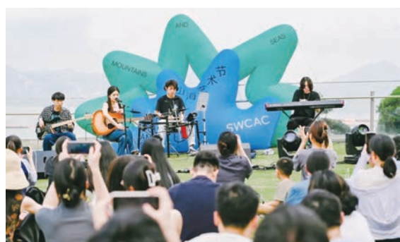
◆ 海上世界文化藝術中心將舉辦第二屆藝術社區活動「山海藝術節·秋夕月」活動