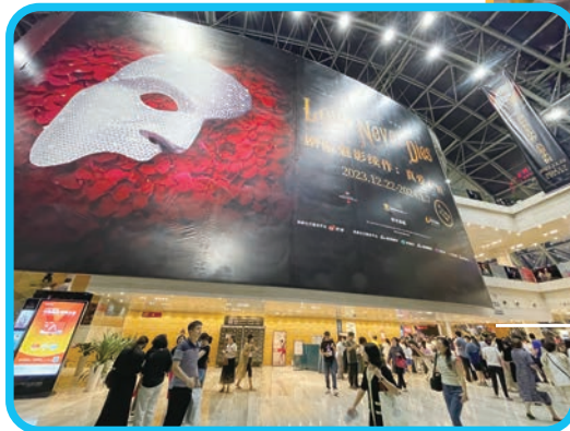
◆ 位於南山海岸城商圈的深圳保利劇院不斷有經典劇目上演。