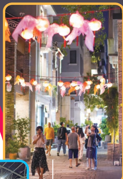
◆ 此次假期，南頭古城點綴以東陽竹絲燈與潮汕竹編油紙燈籠，「非遺」手工藝交錯於街道間。

附近喝個下午茶、吃點西式簡餐、來杯創意咖啡。吃飽喝足後，行至價值工廠打卡，這裏4座高聳的灰牆圓筒，是工業獨有的肌理感，不失為留影打卡的好去處。然後便前往海上世界文化藝術中心，這裏山海環繞，亦是深圳離海最近的藝術館，全年均有展覽展出。最後，來到最具市井煙火氣的蛇口老街，感受屬於蛇口安逸質樸的生活氣息，吃遍這裏的寶藏老牌小店，非常愜意的假期一天就這樣渡過，閒適、浪漫而有質感。