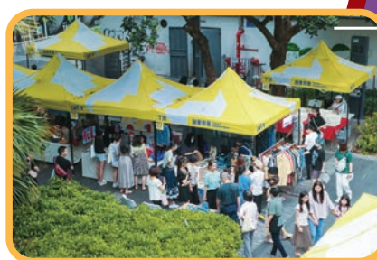
◆ 華僑城創意園T街的市集活動，也讓年輕人逛出了藝術與時尚。