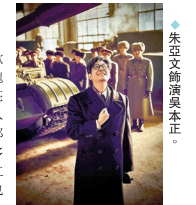
◆朱亞文飾演吳本正。

飛宇、張有浩、歐豪、魏晨、尹昉、魏大勳8位青年演員亮相。73年前，中國人民志願軍入朝，大部分戰士都不過20多歲，他們跨過鴨綠江為祖國而戰，命運也因此而改變。有別於以往的抗美援朝題材影片，今次《志願軍》看點是這些戰火中的青春身影。1950年朝鮮內戰爆發，美國武裝干涉朝鮮內戰，戰火燒到了鴨綠江邊。中國人民志願軍在新中國1歲之際，跨過鴨綠江入朝作戰，保家衛國。我們為何而戰？面對軍備實力強大的美軍如何作戰？《志願軍：雄兵出擊》便是圍繞着決策出兵、初入朝鮮這一驚心動魄的階段展開故事。陳凱歌導演的《志願軍：雄兵出擊》無疑是一部承載着歷史記憶與國家情感的作品，讓我們重新審視那段歷史，並更加珍惜今日的和平與安寧。