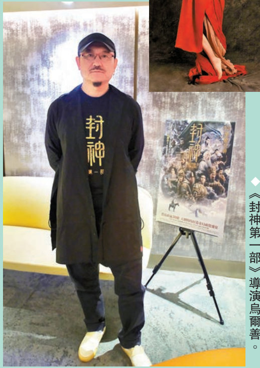
◆《封神第一部》導演烏爾善。