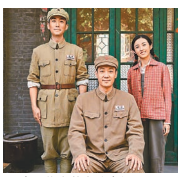
◆朱一龍在戲中演李想。