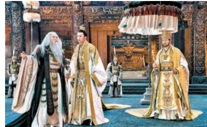
◆費翔飾演大商二王子殷壽。