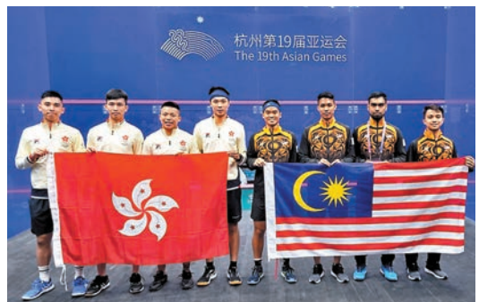
◆香港男子壁球隊昨雖以1:2敵馬來西亞，但仍以小組次名晉4強。

除鐵人三項外，壁球亦會在今日上演團體準決賽，本港男女壁球隊在今次亞運勢如破竹，雙雙在小組賽突破重圍，順利晉級4強。今日準決賽，港男隊對陣巴基斯坦，女隊則與印度隊爭入決賽。