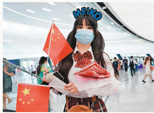
◆有粉絲戴着Meiko名字的頭箍，入場為偶像打氣。

十幾年前小記也是《英雄聯盟》的重度中毒玩家一員，想不到十幾年後這個少年回憶竟然登上亞運舞台，成為正式比賽項目。「打機」搖身一變化為電競，整個賽事的規模、觀眾以及注目度的確令小記這些傳統體育媒體大開眼界，在很多人眼中沉迷打機的「廢青」，在亞運電競舞台上卻是一顆顆璀璨耀目的明星，甚至有「粉絲」專程提早一小時在場外派發手幅