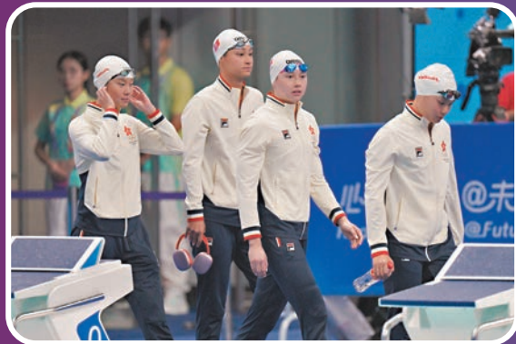
◆港隊在女子4x200米自由泳接力獲得「梗頸四」。