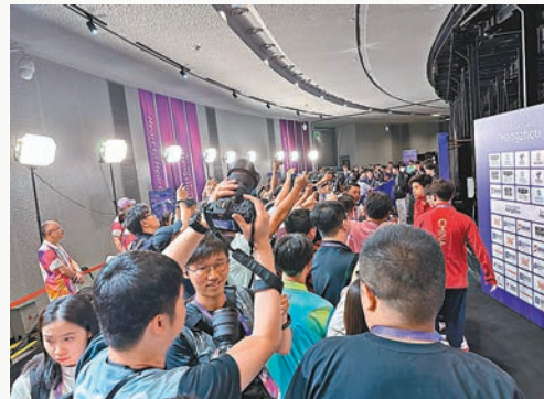
◆傳媒爭相採訪電競「明星」，場面喧嘩。

而另一位粉絲除了手幅外，還戴上了Meiko名字的頭箍，她直言自己平常不會看運動比賽，只有電競賽事才會留意：「可能我自己也有玩遊戲，平常就覺得職業選手特別厲害，而且他們代表國家隊比賽，就更加想去支持他們。」還真別說，據小記現場觀察電競選手的「粉絲」們七成都是年輕女生，而且她們還不是那種膚淺的三分鐘熱度，賽後戰術分析及評價選手表現等都說得頭頭是道，可見當今電競的受眾群基礎有多深多廣。