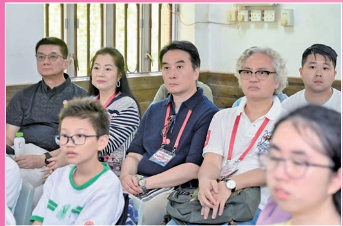
◆ 善德基金會董事局成員帶領學生到訪烏蛟騰歷史營地。