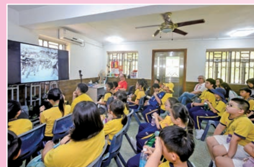
◆ 學生在烏蛟騰營地觀看抗戰紀錄片。