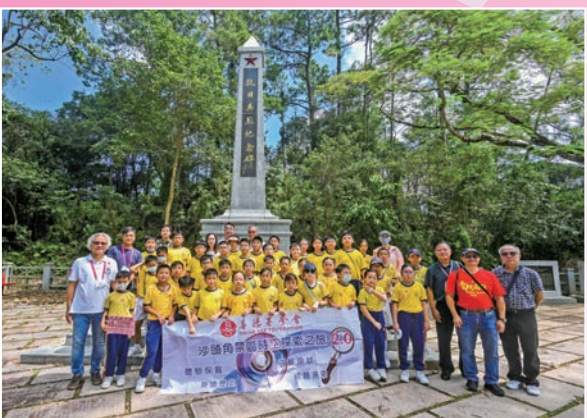
◆ 考察團到訪烏蛟騰烈士紀念碑。