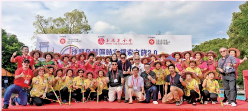
◆ 善德基金會董事局成員與眾嘉賓及沙頭角鹽寮下村陸上龍舟隊合照。