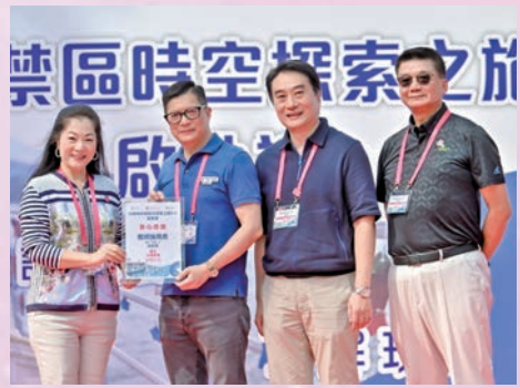
◆ 保安局擔任考察活動協辦機構。