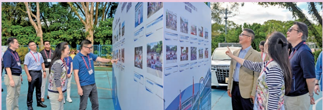
◆ 嘉賓觀看活動展板。

基金會日前舉行「沙頭角禁區時空探索之旅2.0」啟動禮，活動邀得保安局局長鄧炳強、駐港聯絡辦新界工作部副部長李功勳、立法會議員黎棟國及林振昇主禮。在啟動禮後，善德基金會主席董吳玲玲及一眾董事局成員帶領學生探索沙頭角風光，望學生多了解國家歷史及民族文化。