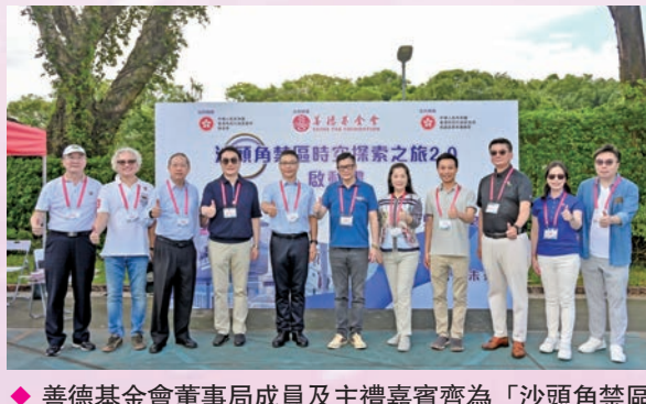
◆ 善德基金會董事局成員及主禮嘉賓齊為「沙頭角禁區時空探索之旅2.0」點讚。