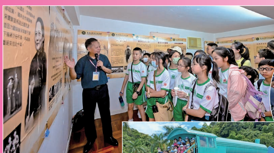
◆ 學生們專心聆聽烏蛟騰抗戰歷史。