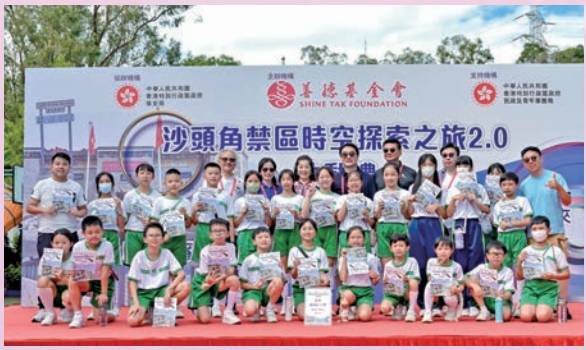
◆ 善德基金會董事局成員與參與學校鳳溪第一小學生合照。