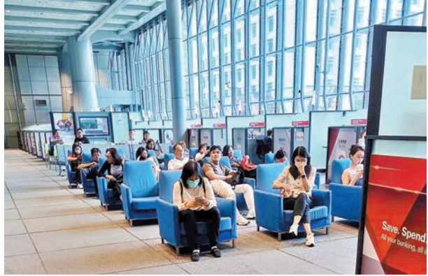
◆中環匯豐香港總行內，有大量客戶在排隊等候。

天下攘攘，皆為利往；天下熙熙，皆為利來。以前內地人民幣定存利息較香港高，且人民幣正處升值階段，吸引很多港人北上存人民幣。如今，風水輪流轉，香港有大量高息美元、港幣、英鎊等存款產品，加上人民幣今年以來持續大幅貶值，近半年來兌美元貶值6.17%，因此，大批內地客來香港開戶做定存，更有人從東北、上海、浙江等地坐飛機來，目的就是來開香港銀行賬戶辦理存款。