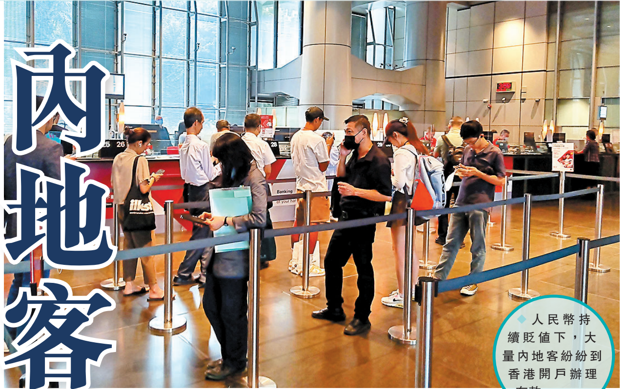
◆人民幣持續貶值下，大量內地客紛紛到香港開戶辦理存款。