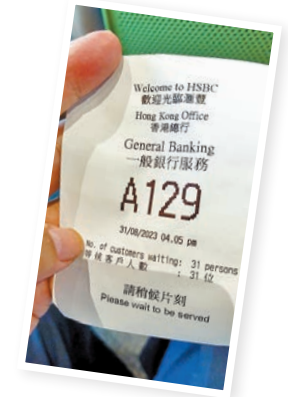
◆記者的籌號是A129號，意味當天至少有逾百位客戶前來諮詢和辦理開戶。