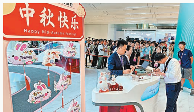
◆ 有銀行推出抽獎活動,吸引過百人排隊。