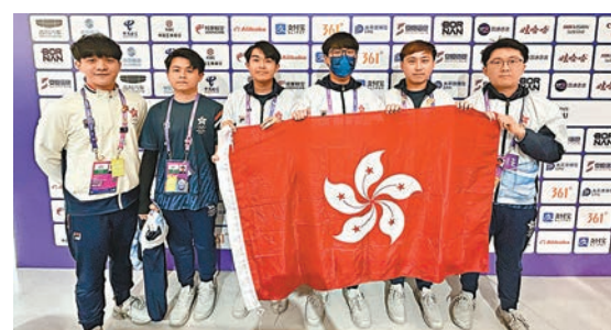
◆ 港電競隊今將在《夢三國2》項目與國家隊爭冠。

香港文匯報訊(記者 敖敏輝 杭州直擊)昨日上午,在杭州亞運會電子競技項目《夢三國2》準決賽中,港隊以2:0戰勝泰國隊,晉級決賽,這也意味著港隊已鎖定亞運會首枚電子競技項目獎牌,坐銀望金。