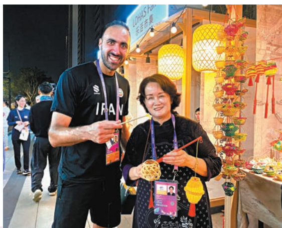
◆ 伊朗運動員(左)獲「西溪小花籃」傳承人贈送竹編小花燈。

香港文匯報訊(記者 俞畫、王莉 杭州直擊)伴隨着中秋節的到來,因亞運而相聚杭州的各個國家和地區的運動員,一起感受美滿團圓的節日氛圍。昨晚,一場精彩的「遇見中秋」綜合文藝晚會在杭州亞運運動員村舉行,雖然天公不作美,原定於7點30分開場的晚會因大雨延遲了半個多小時,但仍為遠道而來的運動員們提供一場精彩紛呈的中國傳統文化盛宴。