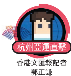
香港文匯報記者 郭正謙

亞運壁球向來是港隊強項,上屆於雅加達就取得兩金兩銀的佳績,雖然正值換血時期,不過港隊於今屆杭州亞運仍有好表現,上屆後備