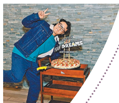
◆Eason完成北美6場巡迴創下驕人成績。