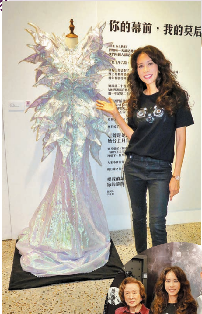
◆展覽展出莫文蔚演唱會的歌衫。