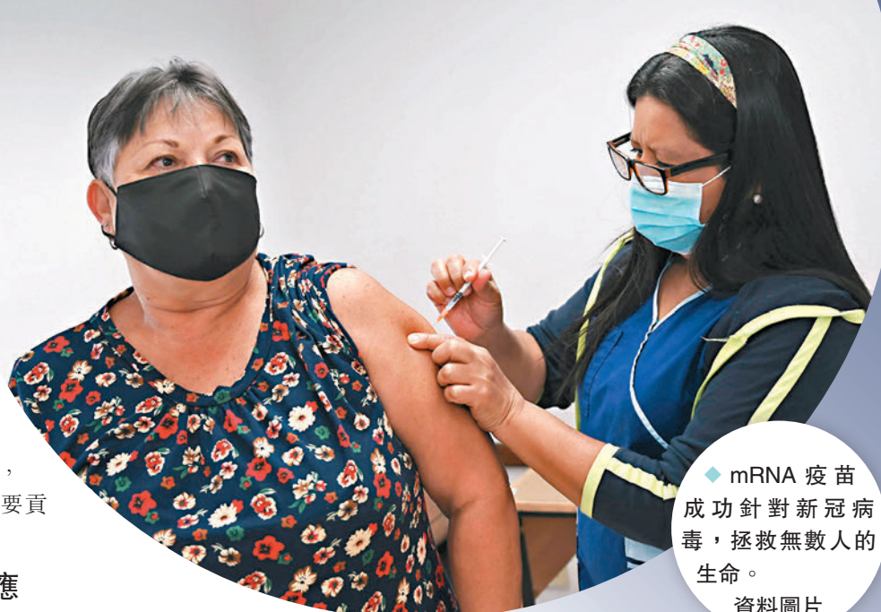
◆mRNA疫苗成功針對新冠病毒，拯救無數人的生命。

韋斯曼透露，他常與實驗室的同事們開玩笑說，「研究工作就是退後兩步，前進一步。」做研究的過程裏，許多事情都沒有作用，更多想法行不通，研究者必須做兩件事：一是具備很多可測試的點子，二是研究者必須從失敗中汲取教訓，「未曾經歷過失敗，才是真正的失敗。」