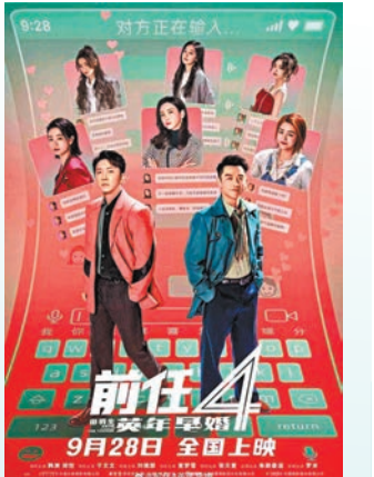
◆《前任4》繼續上演「揪心」愛情故事。