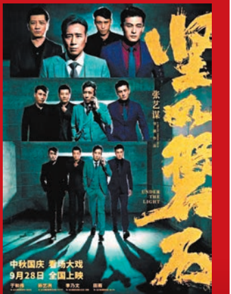
◆《堅如磐石》聚焦掃黑除惡鬥爭中的正義之戰。