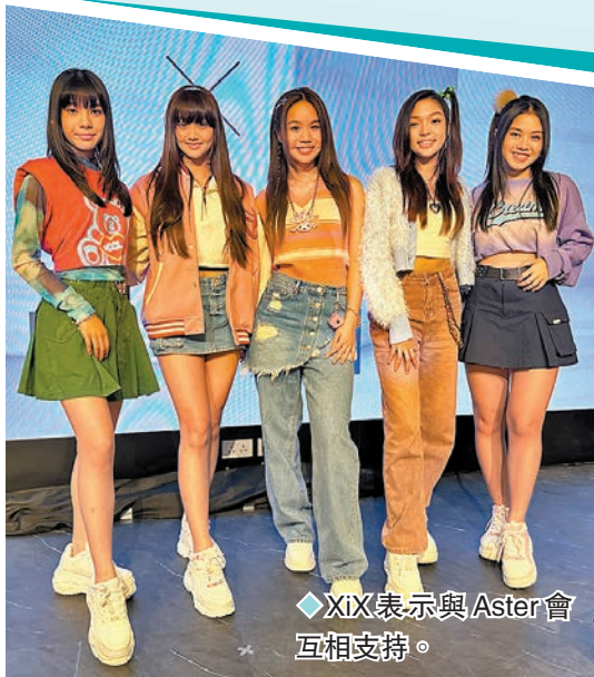
◆XiX表示與Aster會互相支持。

截至10月1日晚，今年以來全國電影票房已達460億元，接近2021年全年票房470億元。中國電影方面表示，2019年至2021年國慶假期內的票房體量均超40億元左右，假期後好口碑影片還會有長尾效應，預計今年中秋國慶檔整體票房在40億元以上，仍有擴展空間。