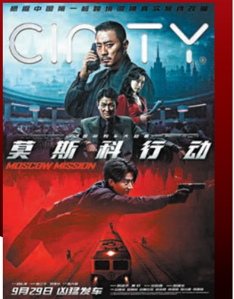
◆劉德華和張涵予時隔20年再度合作《莫斯科行動》。