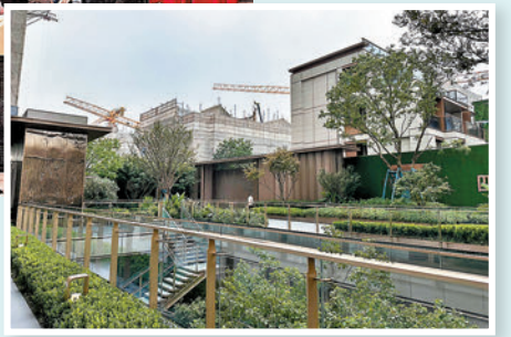
華發四季河濱的別墅項目開盤後很快售罄。