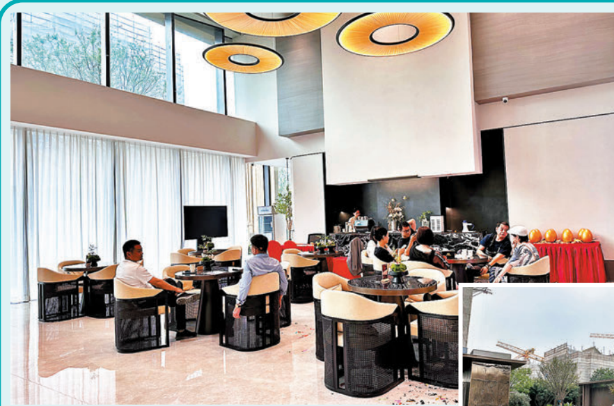
華發四季河濱售樓處內工作日依然有看房者，每天都有若干單認購完成。