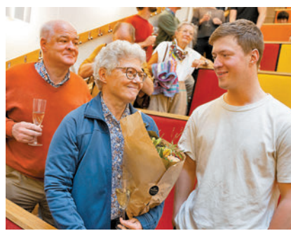
呂利耶中接受丈夫及兒子祝賀。

阿秒物理研究為呂利耶贏得無數獎項,包括2011年獲「世界傑出女科學家成就獎」。她坦言從未想過放棄教職,「我愛教學,更愛與他人分享我對待科學的態度和方法。」而作為女性科學家,她堅持女性也可從容應對家庭和科研,「只要想做,終究是能做到的。」