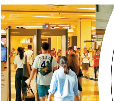
◆ Siam Paragon 入口設有金屬探測器。網上圖片