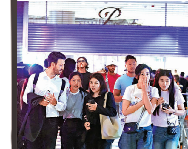
◆商場民眾疏散後，對槍擊案發生猶有餘悸。