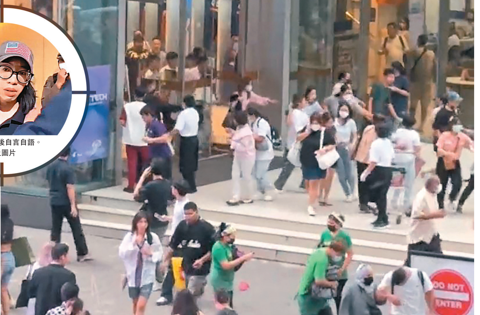
◆商場傳出槍聲後，人群爭相從出口離開。