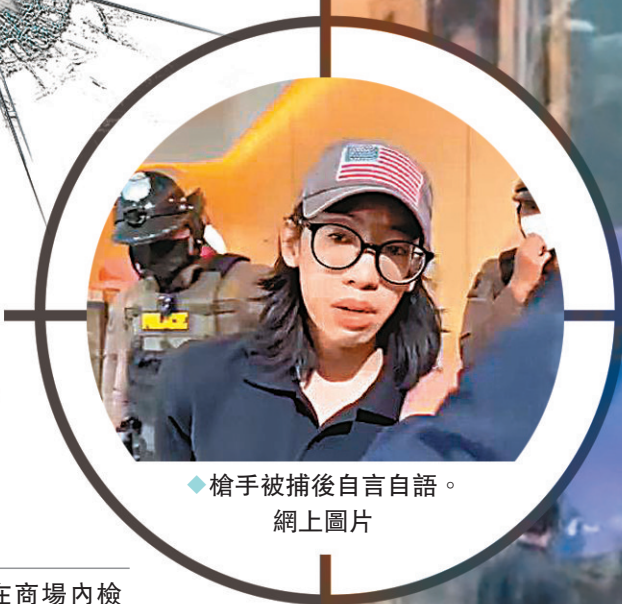
◆槍手被捕後自言自語。網上圖片

Siam Paragon 位於曼谷繁華的暹羅地區，為港人遊覽曼谷的其中一個熱門商場。社交網站流傳的影片顯示，事發時有數以百計民眾紛紛逃出商場。據當地傳媒稱，警方接報指一名槍手向民眾開槍，有目擊者聽到約4至5聲槍響。警方趕到後包圍附近區域，並把疑犯困在商場二樓，疑犯之後自行放下武器投降。閉路電視畫面顯示，疑犯身穿深色衣服、迷彩褲，戴着手套及穿靴子。報道指疑兇使用的是9毫米口徑的 Glock 19 手槍。