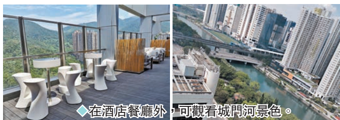
◆在酒店餐廳外，可觀看城門河景色。

如果酒店有性格，帝逸應該是一位善談有趣的陽光帥小伙。開放專門的樓層，也讓自己進入寵物友好型酒店的行列。帶著寵物住酒店，在內地許多一線城市，各城各地都有網友熱心總結的「十大寵物友好酒店」排行榜。如何照顧「寵物主子們」的度假需求呢？將心比心對待寵物朋友們。從準備的寵物所需零食、清潔用品，專屬餐具甚至專屬的浴袍，也讓不少入住者的心瞬間被「萌化」。三樓的寵物娛樂草坪，是每一個寵物到來後就盡情撒腿、奔跑探索的遊戲小部落。九、十月的天，風吹呀吹，白雲走得很快，一間舒服的酒店可以令你好好發懶一下。