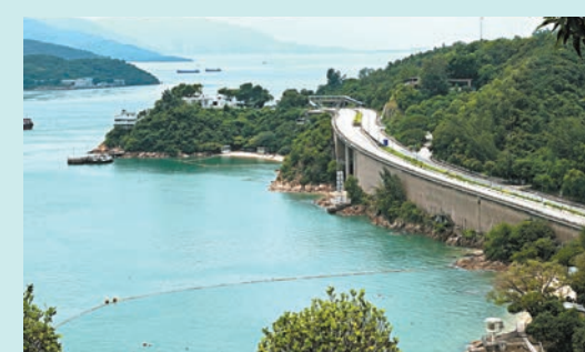
◆可以看海路橋風景的房間

齡段覆蓋。童年的樹屋、青年的電競屋，長租的商務房，相比過客匆匆的鬧市酒店，此地顯然希望發展出「快樂驛站」的情誼。酒店也十分坦誠，主打高性價比的房型，2張雙人床，可入住4人，家人、朋友一起前來，合適省錢、住得舒服。人均價格，據說來過的遊客紛紛感嘆「平靚正」。