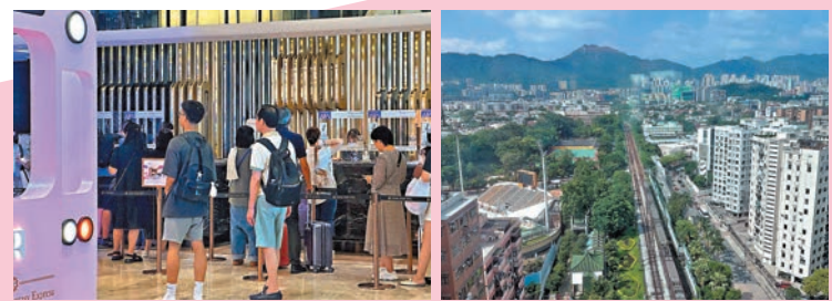
◆不少內地客讚譽它為「性價比之王」 ◆酒店「獅房菜」可享獅子山景觀