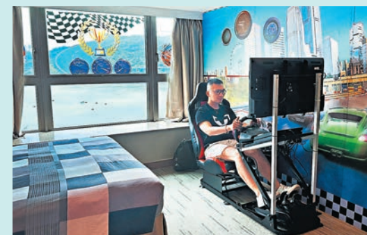
◆帝景酒店的電競主題房間

齡段覆蓋。童年的樹屋、青年的電競屋，長租的商務房，相比過客匆匆的鬧市酒店，此地顯然希望發展出「快樂驛站」的情誼。酒店也十分坦誠，主打高性價比的房型，2張雙人床，可入住4人，家人、朋友一起前來，合適省錢、住得舒服。人均價格，據說來過的遊客紛紛感嘆「平靚正」。