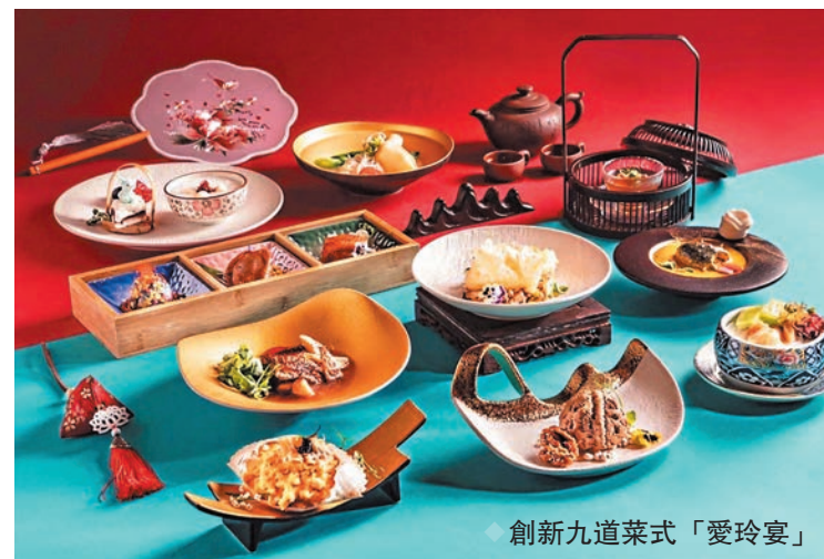
創新九道菜式「愛玲宴」

旺角的交通便捷，也是香港各區的便捷中轉站，吸引人在此暫聚。跟朋友相約在旺角見面，不必焦慮時間，因為不管逗留多晚，都有車直送回家。