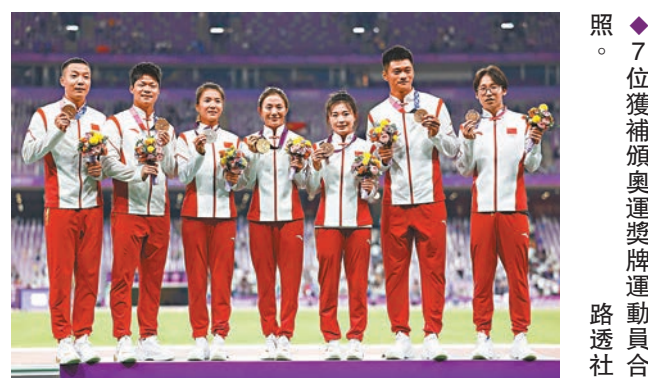
◆7位獲補頒奧運獎牌運動員合照。