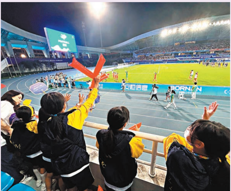
◆遊學團同學現場觀看比賽，受到各種具體的體育精神感染。