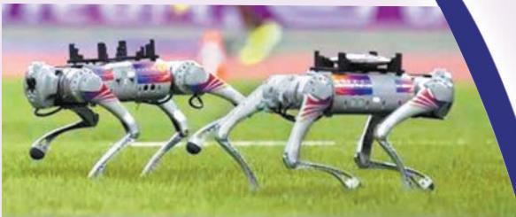
◆機械狗能夠將1至2公斤的標準鐵餅從落點搬運到靠近場邊的指定位置。網上圖片