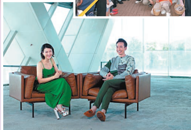
▲陳茵媺與陳豪拍親熱戲嗆尷尬。