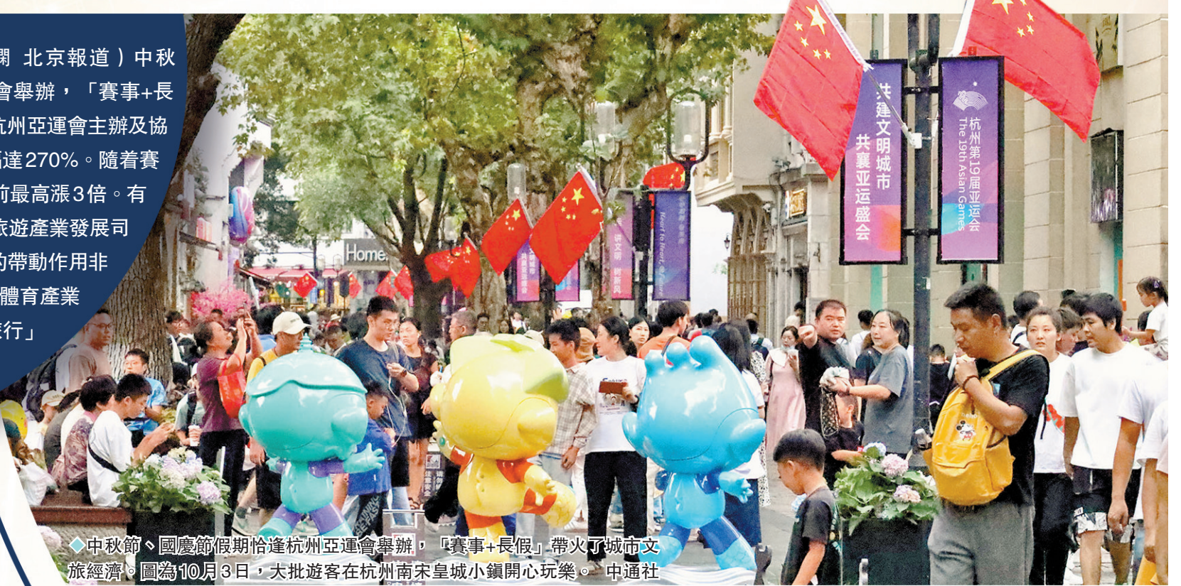
中秋節、國慶節假期恰逢杭州亞運會舉辦，「賽事+長假」帶火了城市文旅經濟。圖為10月3日，大批遊客在杭州南宋皇城小鎮開心玩樂。