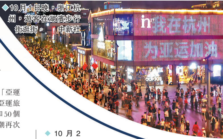
10月1日晚，浙江杭州，遊客在湖濱步行街遊逛。