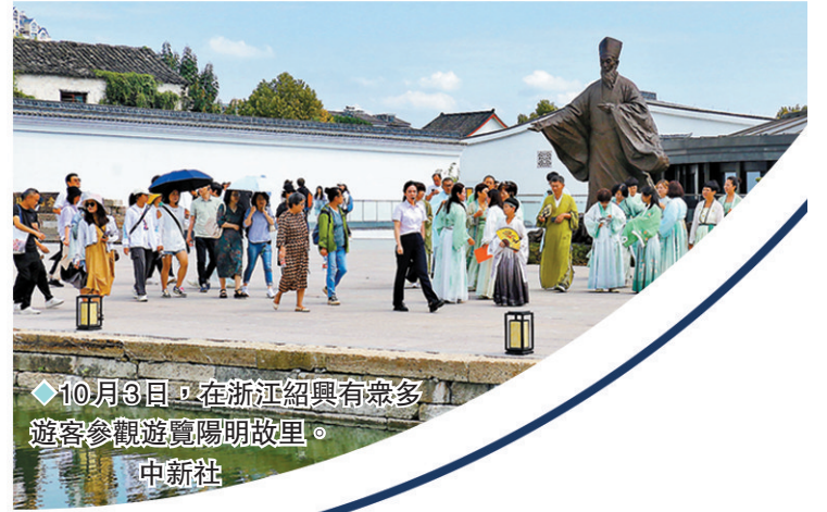
10月3日，在浙江紹興有眾多遊客參觀遊覽陽明故里。