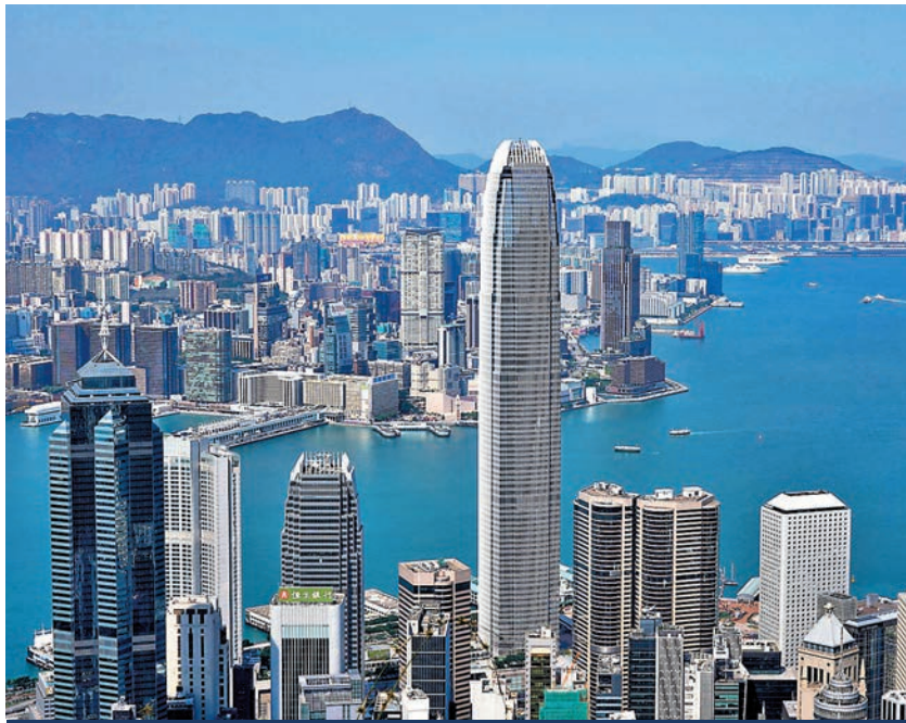
◆彭博分析指出，香港的金融中心地位難被取代，香港擁有的經濟腹地、股市規模，乃至工作薪酬等，都是新加坡難以比擬的。

過去幾年，在香港的銀行家、投資者及資產管理公司等，部分企業及資金流向新加坡。就在坊間爭論新加坡是否取代香港、坐穩國際金融中心亞洲頭把交椅地位之時，彭博昨發表分析指出，香港的金融中心地位難被取代，香港擁有的經濟腹地、股市規模，乃至工作薪酬等，都不是新加坡能夠比擬的。報道指，香港股市總市值約5萬億美元，是新加坡4,000億美元的12倍之多，香港仍然是華爾街打入中國內地市場的「大本營」，一些在疫情期間移居新加坡的投資銀行家正陸續返回香港，一家華爾街銀行已將近一半先離開的員工調回香港，瑞銀亦將之前調走的員工調回了三分之一。