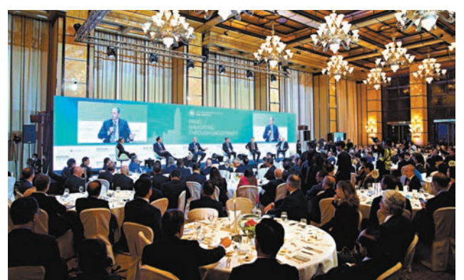
◆香港盛事連連，金管局下月初將再度舉辦國際金融領袖投資峰會。圖為去年在港舉行的國際金融領袖投資峰會盛況。

除峰會外，金管局將於今年餘下時間聯合籌辦10月30日開始的香港金融科技周，以及於11月27日至28日舉行的金管局—國際結算銀行(BIS)高級別會議。適逢今年是金管局成立30周年，希望藉此機會與大家共同回顧金管局和香港金融界過去30載共同取得的成就，分享對未來的期許。這些活動將為2023年繽紛重現的香港增添精彩的一頁。