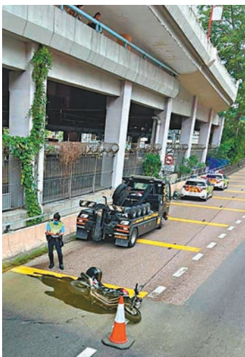
◆車禍後，交通警員趕至封鎖現場進行調查，肇事電單車橫臥路中。

一段相信是「天眼」拍攝的片段顯示，當時電單車沿大埔公路沙田段向大埔方向行駛，在新城市廣場對開，車身突然擺動復翻側，片中可見有人被拋起墮地。