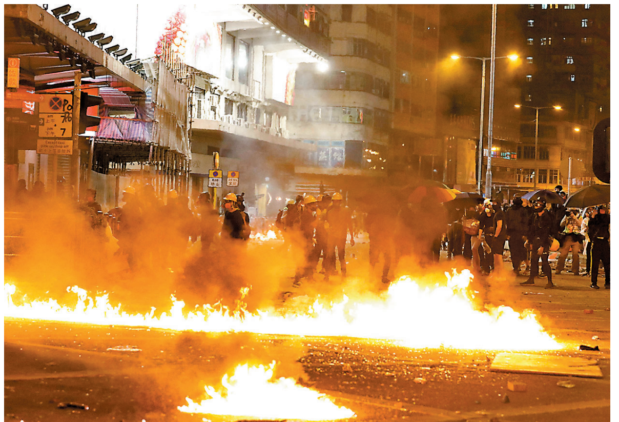
◆2019年11月18日，近二千名黑暴分子在油麻地一帶大肆破壞及投擲汽油彈攻擊警方防線。

警方昨日在庭外表示，這宗在理工大學發生的暴動案，共有213人被起訴暴動等罪，在區域法院分