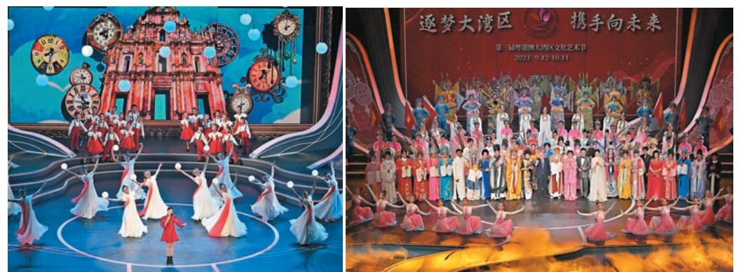
◆澳門歌手王心好演唱《七子之歌》。