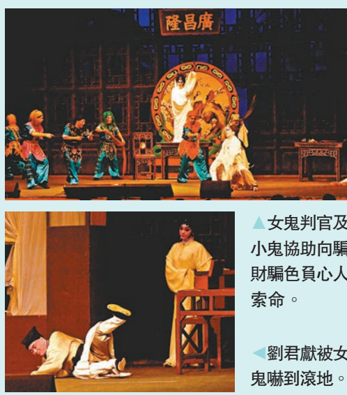
▲女鬼判官及小鬼協助向騙財騙色負心人索命。