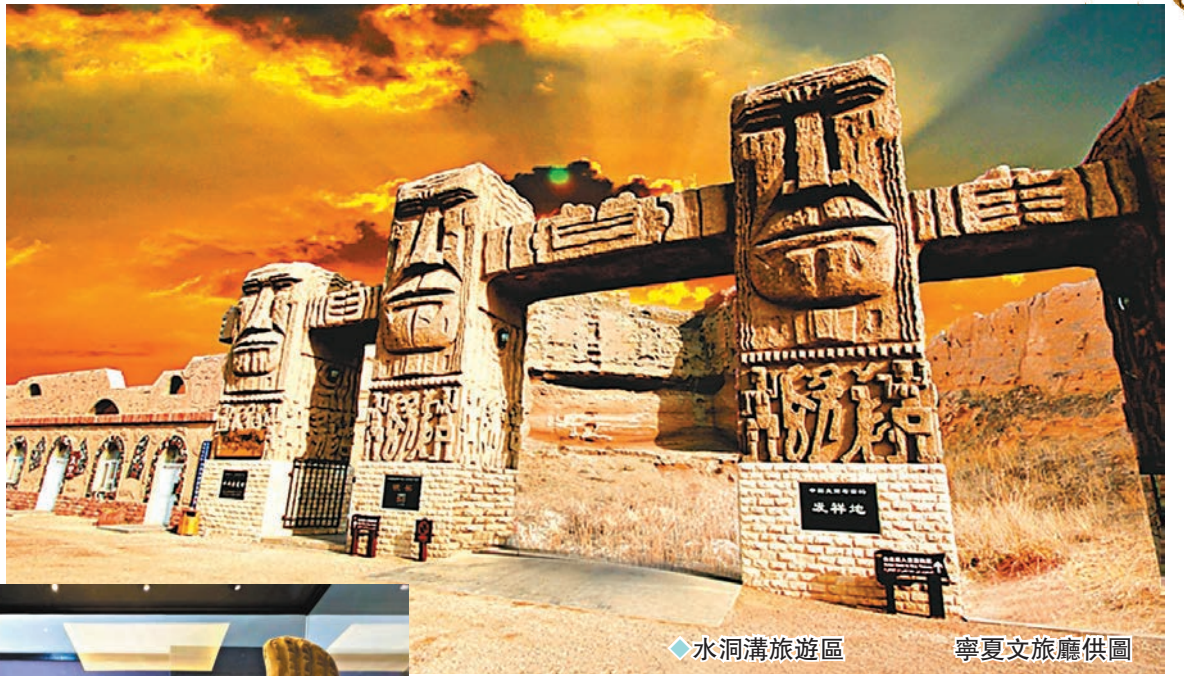
◆水洞溝旅遊區

水洞溝遺址位於寧夏回族自治區靈武市，於1923年被發現及發掘，是中國最早發掘的舊石器時代遺址之一，被譽為「東方史前考古的搖籃」。