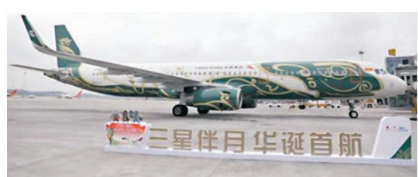
◆該飛機外觀以三星堆文化元素為主要視覺形象。

機艙內，三星堆的文化元素也無所不在，行李架、座位均滿飾太陽鳥、太陽輪、青銅神獸等三星堆文化元素，與機身外觀圖案遙相呼應。作為一座移動的文化空間，飛機座艙周邊的讀物也會向遊客展示燦爛的三星堆文化和三星堆創新發展新風貌，陪遊客度過一段難忘的三星堆文化之旅。