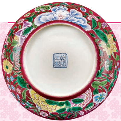
◆清乾隆胭脂紅地磁彩九秋紋盤。

而當「九秋同慶」出現於大器之上時，則改為採用更為淡雅的底色。如筆者所收藏的一對「清嘉慶九秋同慶圖雙耳大瓶」，雖通體繪有密不透風的九秋圖，但富含美好寓意的同時，因其細膩的筆觸及適時的留白，給人以清雅之感。