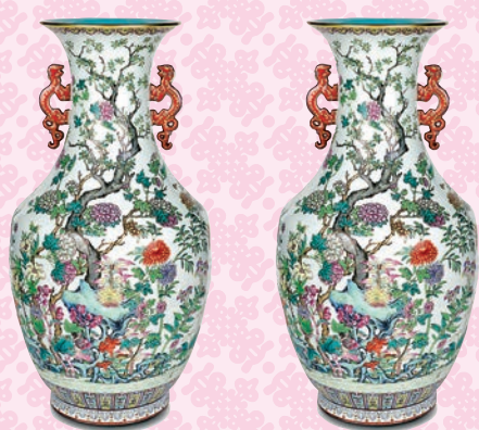
◆清嘉慶九秋同慶圖雙耳大瓶（一對）。