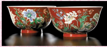
◆清康熙珊瑚紅地五彩「九秋同慶」圖盤（一對）。