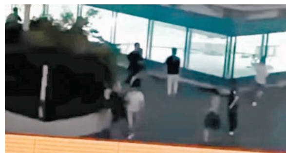
◆石籬商場平台有逾十人追打事主。

警方呼籲任何人如有失蹤人士消息，可致電28601040或98860034與港島總區失蹤人口調查組，或與任何一間警署聯絡。