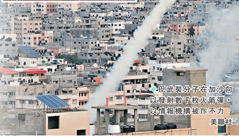
◆巴武裝分子在加沙向以發射數千枚火箭彈，以情報機構被斥不力。

《華爾街日報》形容，以色列對今次襲擊顯然猝不及防。報道引述以國情報部門最近對哈馬斯的評估，當中還顯示以方認為哈馬斯已轉移重心，尋求「避免從加沙發動重大襲擊」，以防以國採取「懲罰性軍事措施」。以色列特拉維夫國家安全研究所研究員埃爾蘭直言，「所謂『哈馬斯趨於穩定』的說法，就這樣以毀滅性的方式被粉碎了。」