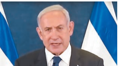
◆內塔尼亞胡發表全國電視講話。

專家指出，內塔尼亞胡本就因涉貪身陷司法風波，如今右翼政府內外交困，內塔尼亞胡若不強硬回應今次襲擊，就無法迎合成執政聯盟的5個右翼黨派訴求，也無法在安全議題上籠絡選民支持。這也意味今次巴以衝突恐怕無法短期結束。