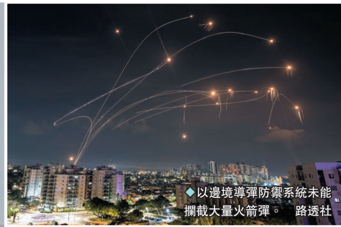
◆以邊境導彈防禦系統未能攔截大量火箭彈。路透社