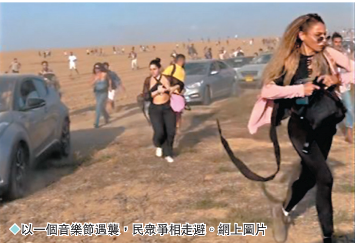
◆以一個音樂節遇襲，民眾爭相走避。

以色列駐法國大使摩拉夫承認，以國情報系統存在問題，「如果我們事先有哪怕一絲情報，都會準備反擊。我們必須吸取教訓。」BBC也引述以國匿名官員消息稱，以國內部針對情報機構失靈的調查已經開始，料會持續數年。