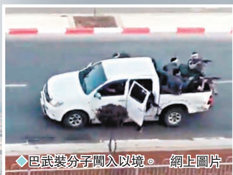
◆巴武裝分子闖入以境。

香港文匯報訊 控制加沙地帶的巴勒斯坦武裝組織哈馬斯上週六(10月7日)發動襲擊，至今已造成巴勒斯坦及以色列共近1,000人死亡，數千人受傷。巴以衝突驟然升級震驚全球，令外界錯愕的是，以色列在加沙邊境耗費數十億美元(相當於數百億港元)構築號稱滴水不漏的防禦系統，今次幾乎毫無防備。以色列與美國密切合作的情報系統也雙雙「失明」，被質疑嚴重失能。以國眾多官員承認，今次事件如同以國版「珍珠港事件」，分析亦指事件暴露美以情報網的盲點，凸顯以國軍事情報系統失靈。