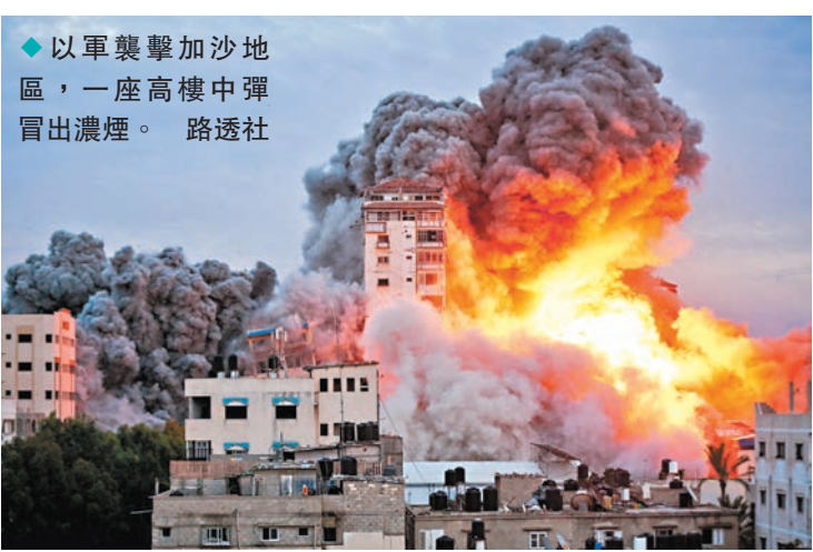
◆以軍襲擊加沙地區，一座高樓中彈冒出濃煙。