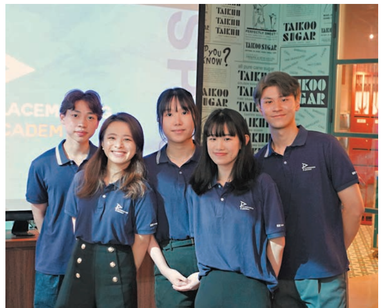
◆「白色聖誕市集」策劃項目大學生代表合影。