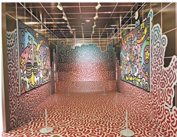
◆ 原作展內布滿藝術家個性塗鴉