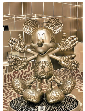
◆ Mr Doodle 雪天使米奇