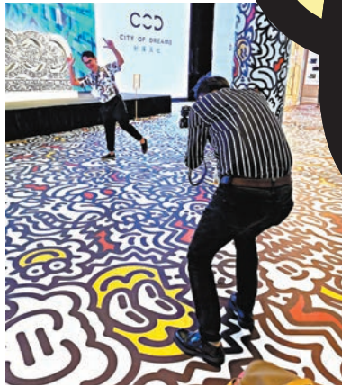
◆遊客打卡塗鴉殿堂