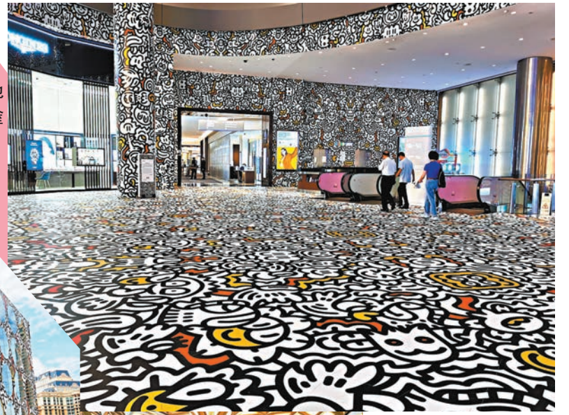
◆ The Show- room 外牆的 Mr Doodle 塗 鴉