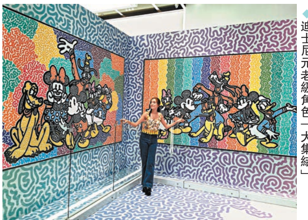
◆ 迪士尼元老級角色「大集結」

是次澳門首展，Mr Doodle通過精心打造的「塗鴉列車」將觀眾們帶入一個塗鴉世界，在裝扮城市的同時，也通過自己的藝術治癒了人心。