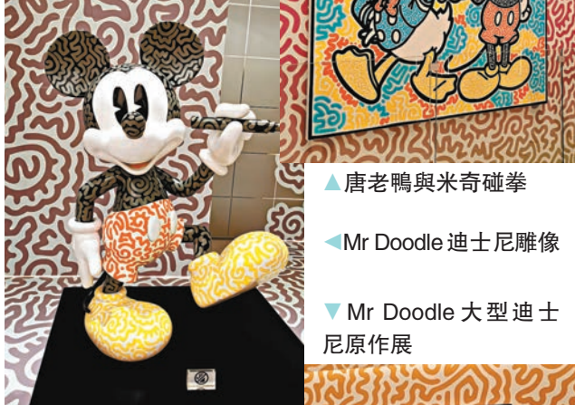
▲唐老鴨與米奇碰拳