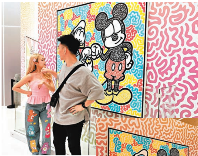
◆遊客模仿唐老鴨與米 奇的動作